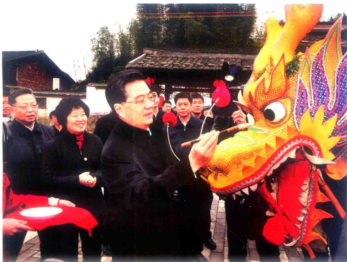
2010年2月13日，时任中共中央总书记的胡锦涛同志在上杭县古田镇五龙村兴致勃勃地为祥龙点睛

在革命战争年代，闽西老区人民为中国革命胜利和新中国建立付出了巨大牺牲、作出了重大贡献。