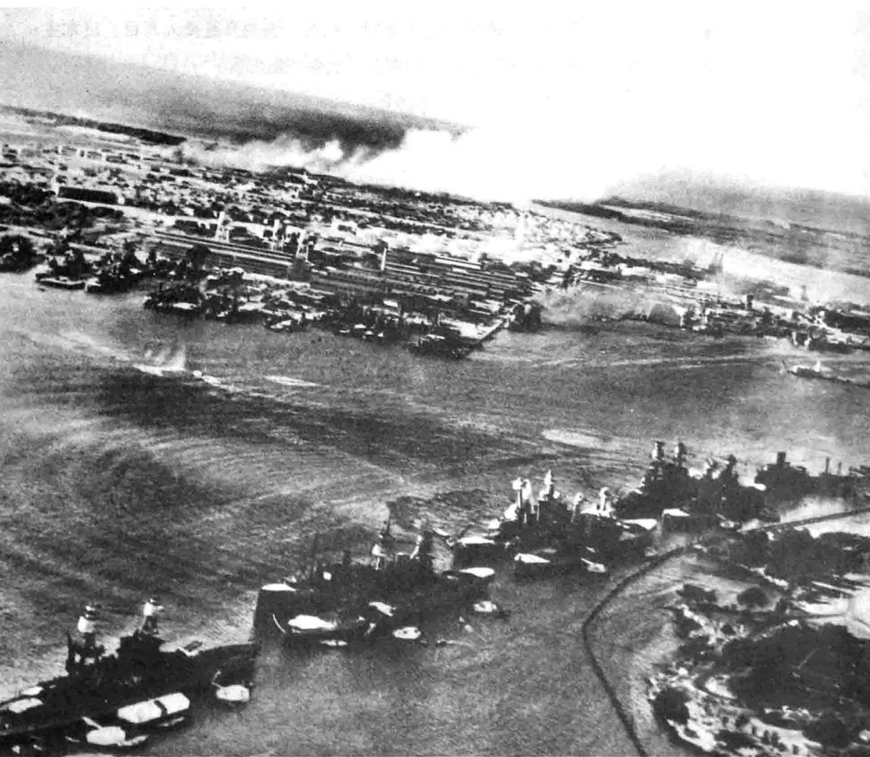
▲日本鱼雷拖着白色尾迹朝着唾手可得的目標飞去，此时，美军战舰编队停泊在福特岛东南岸，“俄克拉荷马”号和“西弗吉尼亚”号正位于舰队之中。