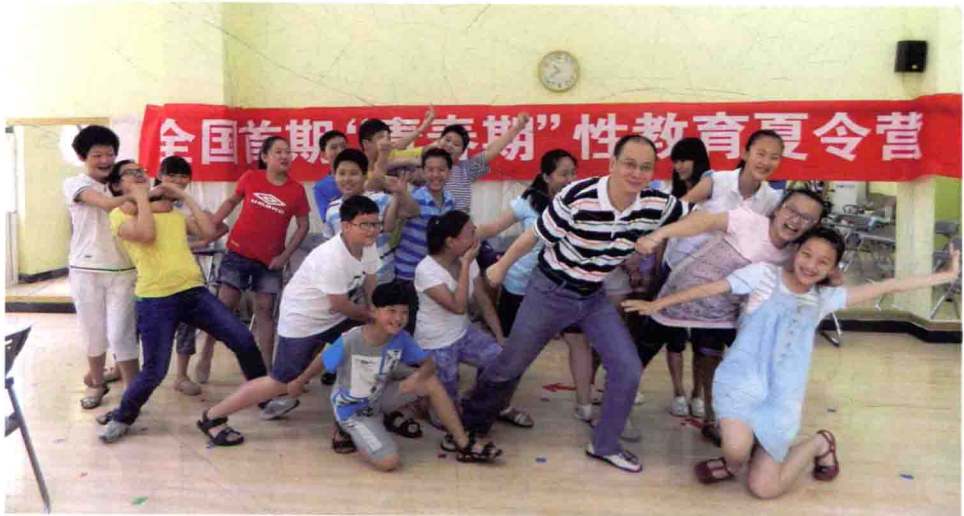
亲自全程讲授初中生性教育夏令营，与学员们合影