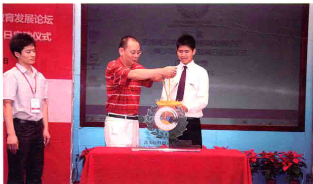
2011年在性教育论坛上洒下性教育的金沙