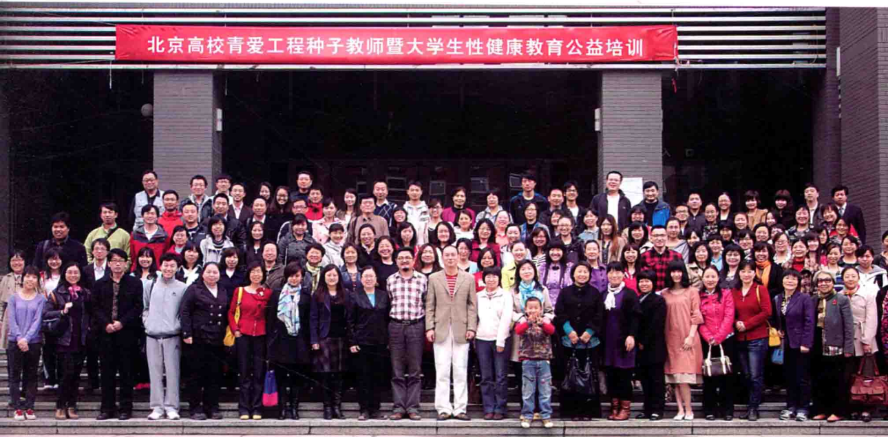
对北京高校学生辅导员进行性教育培训