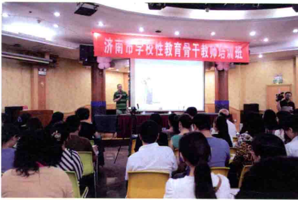
培训济南的性教育骨干教师