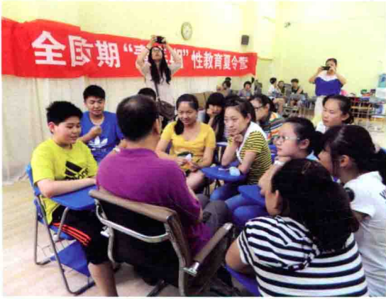
中学生围听性教育