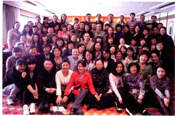
与黑龙江性教育培训学员合影