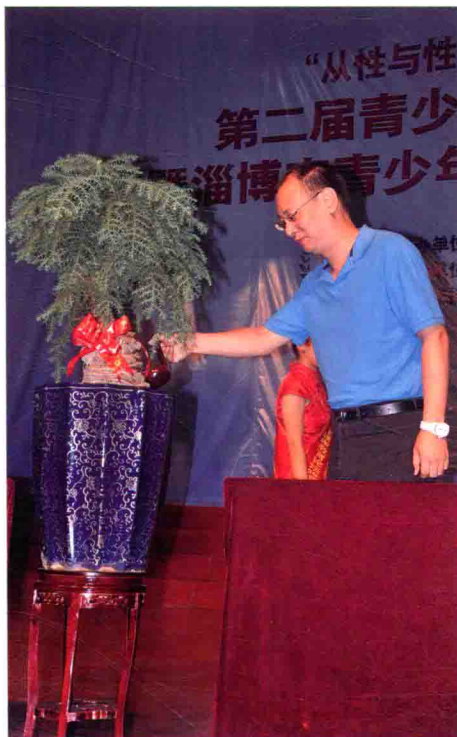
2012年在性教育论坛上浇灌象征性教育成长的树木