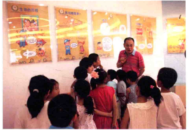
给小学生讲解性教育展览