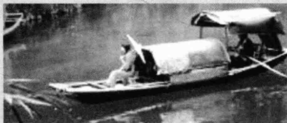
2012年4月9日，摄于湖北三峡人家