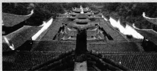
2012年4月8日，摄于湖北恩施土司城