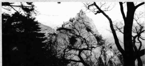
2012年4月20日，摄于湖北麻城龟峰山