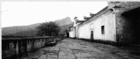
2012年4月7日，摄于湖北利川大水井