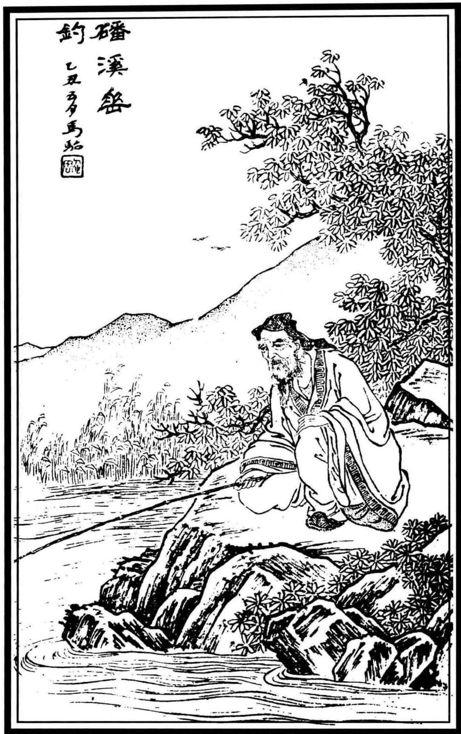
磻溪垂釣圖 清·馬駘