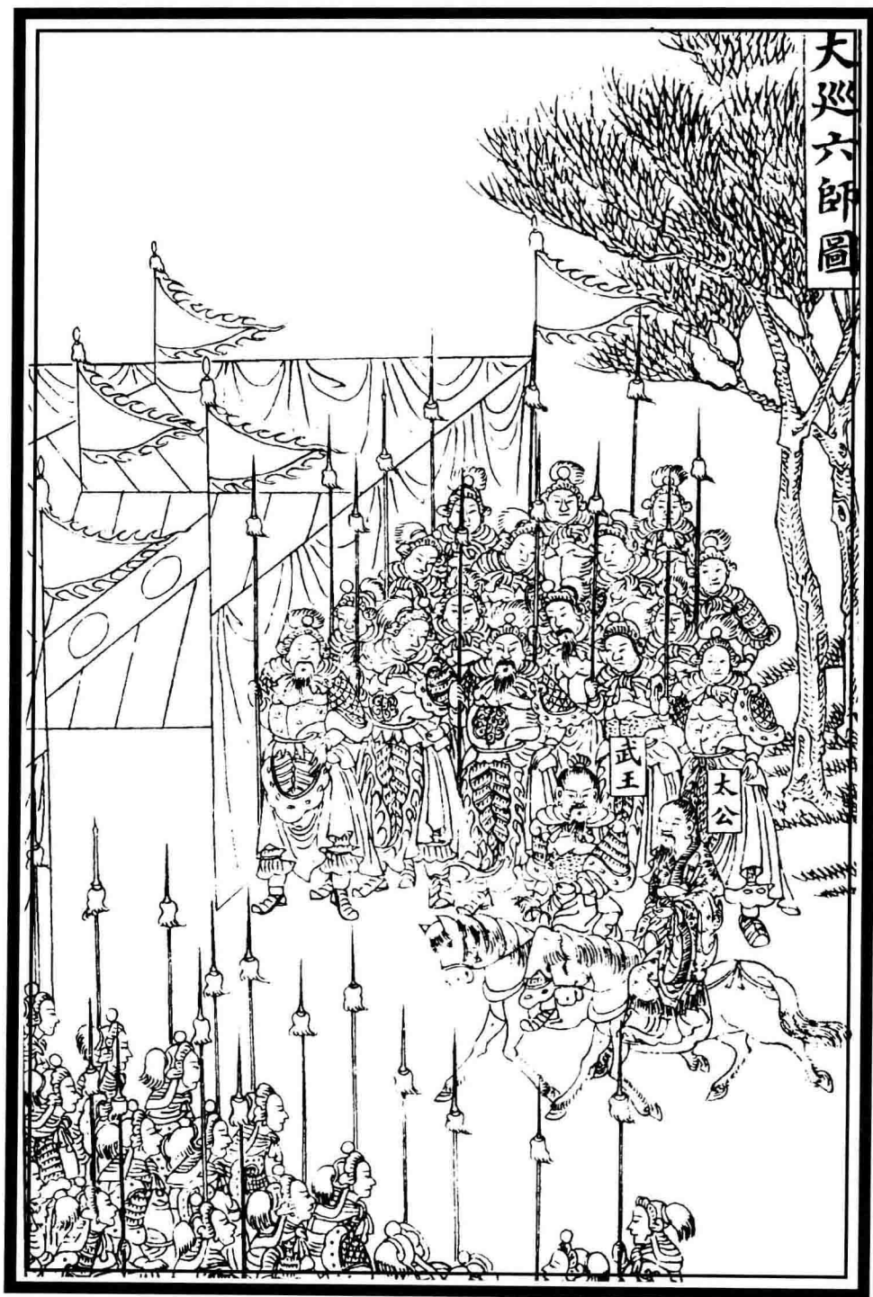
大巡六師圖 清·《欽定書經圖說》