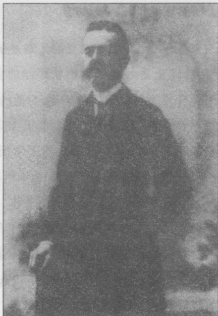
亨利·卡伯特·洛奇

洛奇在国内和国际政治中引人注目的一生，反映了他坚决致力于强大的联邦政府和美国对海外的扩张。他完成的对国内最重要的事务，包括帮助起草《谢尔曼反托拉斯法》(1890)，宣布一切限制贸易的行动为非法，一切谋求垄断的行为为犯罪；以及《纯食物和纯药品条例》(1906)，以保护公众不受危险的食物和药品的伤害。他对《赫伯恩法》(1906)的修正调整了州际之间的铁路，将商业石油管道交州际商业委员会管理。在国际政治中，洛奇支持建立强大的海军，反对英国试图限定英属圭亚那-委内瑞拉的边界(1895)。他完成了侵吞夏威夷群岛(从1893年开始)的努力，支持美西战争及其随后的条约(1898)，并立即吞并了侵占的菲律宾群岛。他还支持