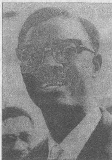
帕特里斯·卢蒙巴

1960年7月5日,刚果独立后的第六天,刚果国家军队发动了兵变,反抗比利时的指挥官。(这次兵变的原因是殖民主义者不甘心退出刚果,企图通过比利时官员及军官控制的行政和军事机构,继续维持殖民统治。——译者注)7月11日,比利时海军轰炸了沿海城市马塔迪,激起了刚果士兵更大的反抗。同一天,加丹加省总督冲伯宣布加丹加从刚果分裂出去,很明显,他受到了该省的比利时居民和