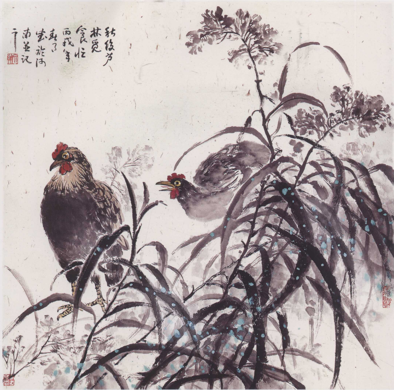
芦花雄鸡 68cm x 68cm

中，他初从书法、中国传统绘画入手，继而进入西画领域，最终又回归到中国传统的绘画上来；这几乎是他们这一代艺术家的生命轨迹。这看似曲折的艺术之路磨练着他们这一代人的艺术才情，最终形成了不同于前人的艺术风貌。