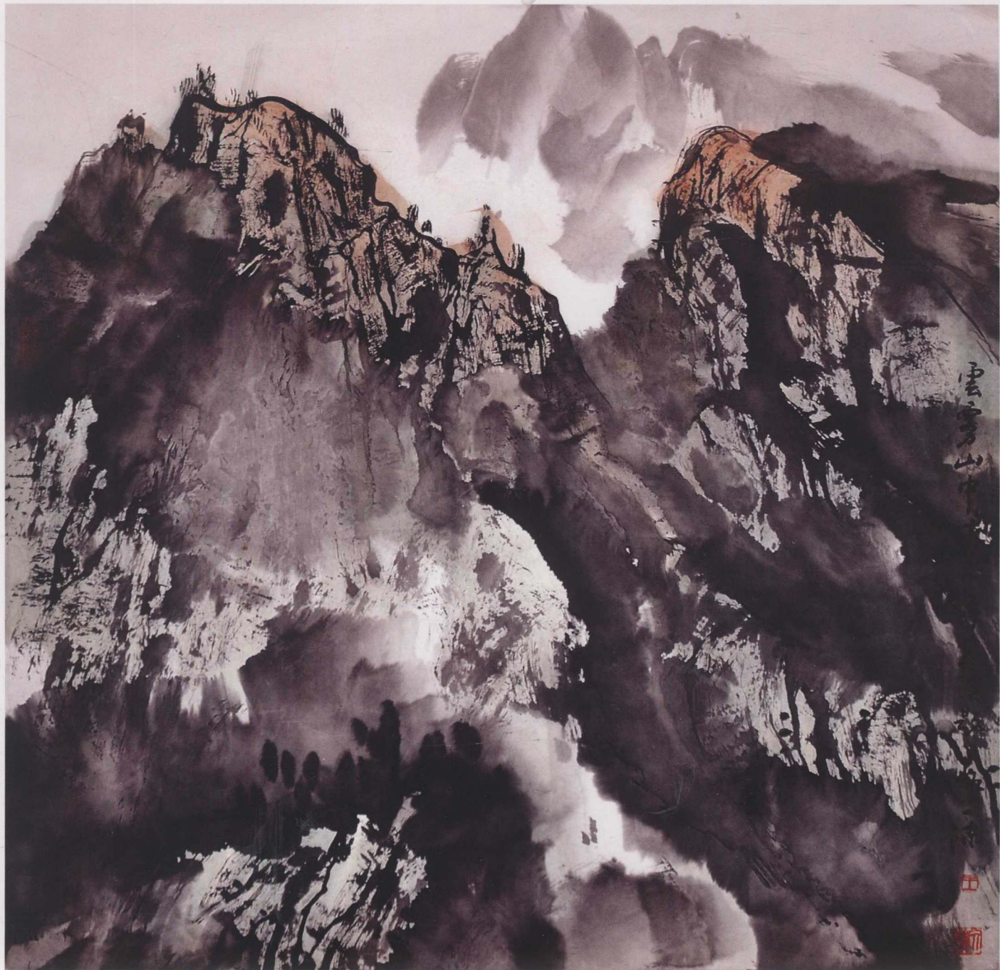
云雾山中 68cm x 68cm