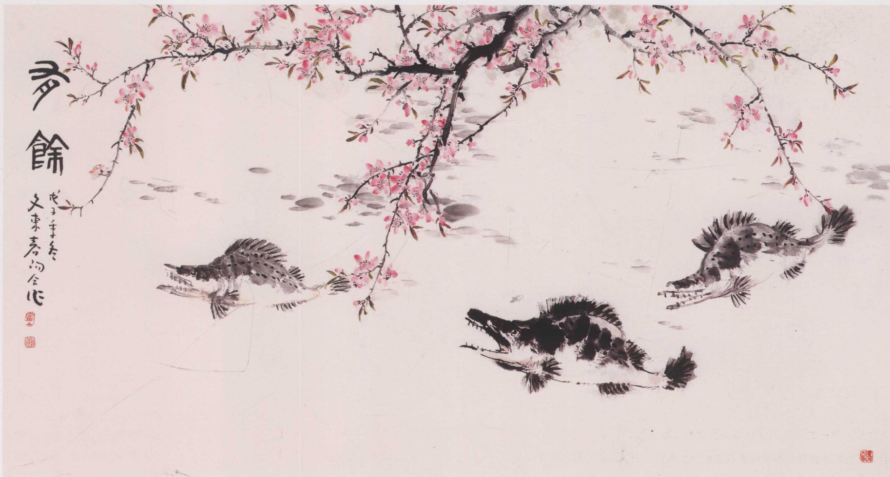
有余图 王文东与霍春阳合作 96cm×178cm