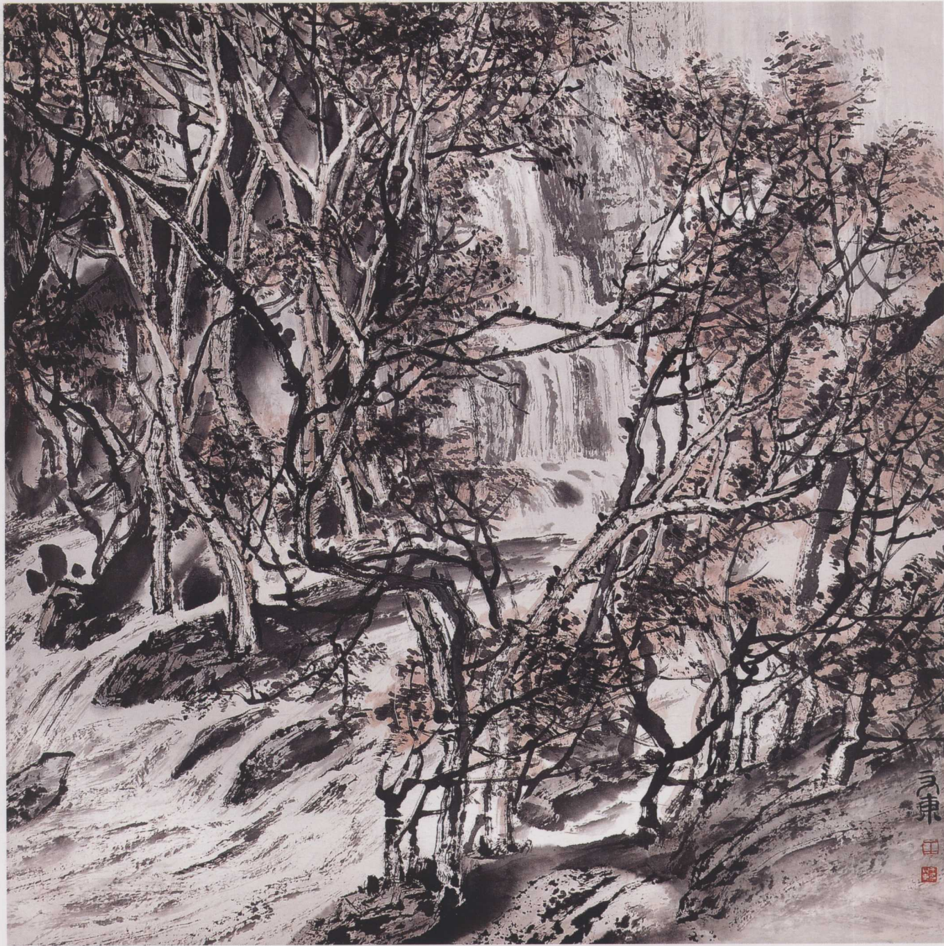
幽谷泉声 68cm X 68cm