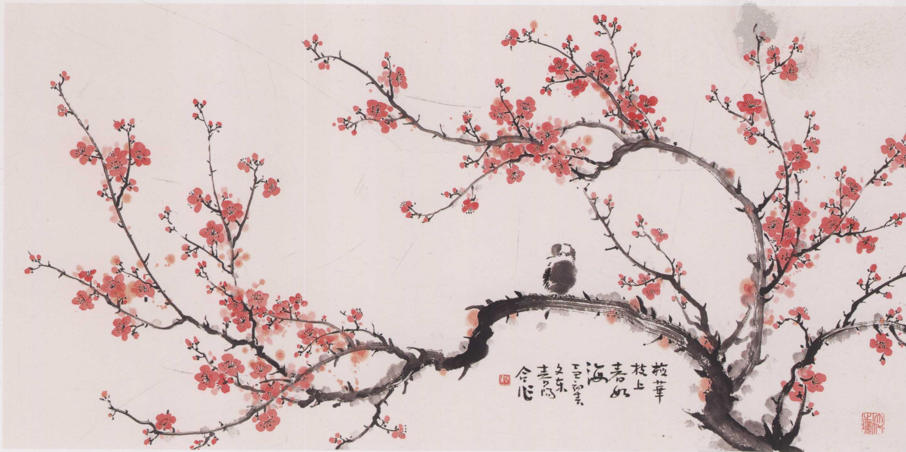
梅花枝上春如海 王文东与霍春阳合作 68cm×136cm