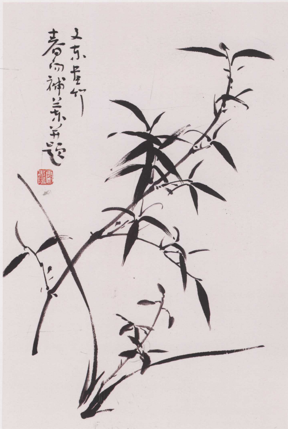
竹兰图 王文东与霍春阳合作 46cm X 68cm

涵，这与王文东先生的艺术追求是不谋而合的。当年他从国画走出去，数十年后又回归国画，对于他来说这是一个必然的结果。经历了多画种的实践、锤炼，他发现自己对国画的理解、对艺术的感悟更深了。