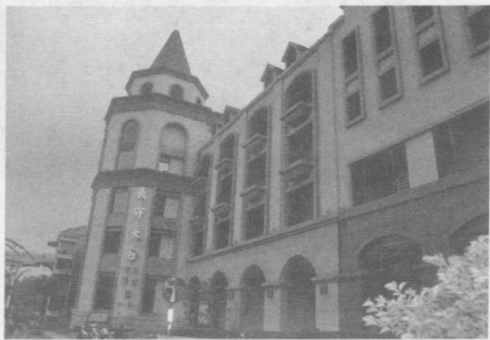
高端、大气、上档次的义守大学学生宿舍

出了宿舍大门是充满法国风情的香榭丽舍大街，街上只有一家集火锅、炒饭、意粉为一体的大杂烩店，虽不如小仲马《茶花女》中描述的香榭丽舍大街那样优雅，