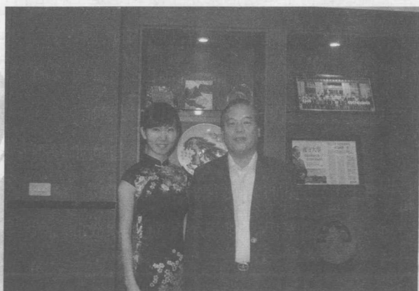
与义守大学校长萧介夫先生合影