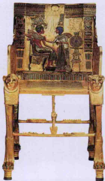
图坦卡蒙的黄金王座