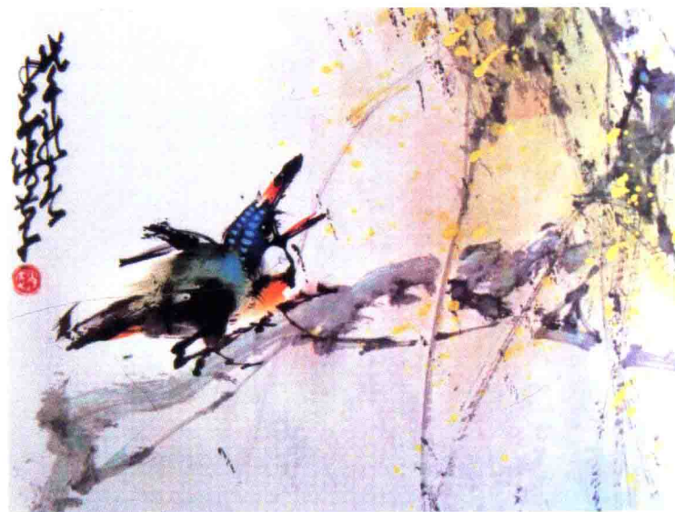
圖 4 《翠色》