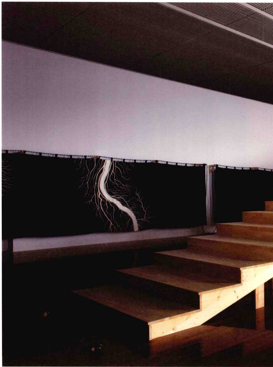
以印有放电场作品的帷幔作为背景，放置在前面的是按照 1/10 比例仿制的古代出云大社的阶梯。阶梯的最高一层，供着一尊镰仓时代的雷神像。