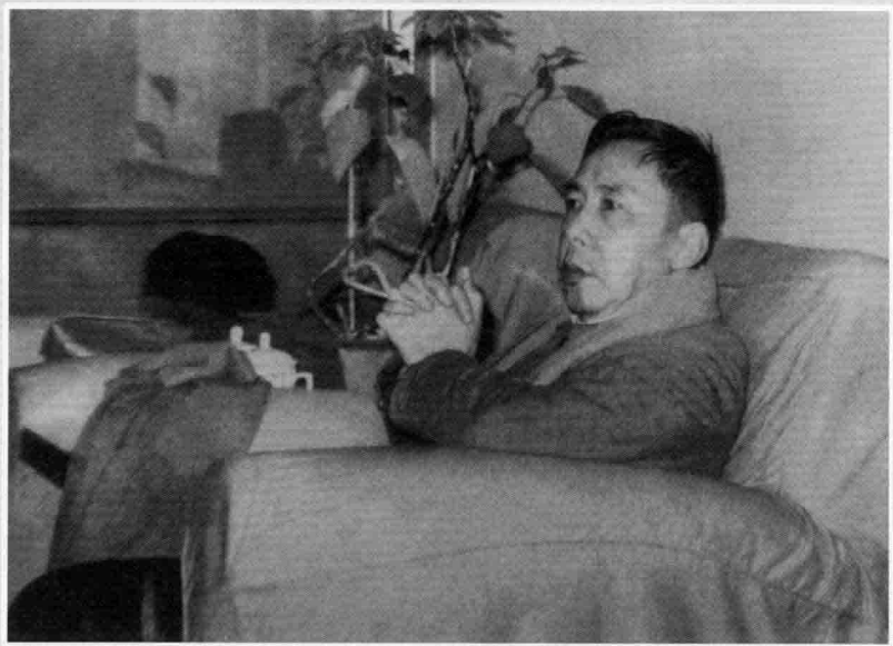
作者在沉思中 摄于 1985 年寓所