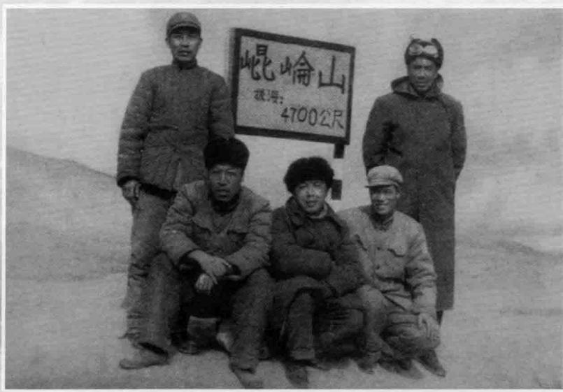
作者在野外试验海拔4700米高度时与干部、队员留影 摄于1965年青藏高原昆仑山顶