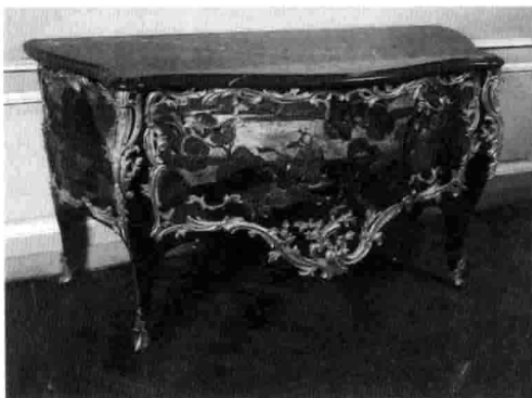
1-6 法国设计生产的洛可可样式衣柜。

教会和国王的威权不同，洛可可的设计更多为世俗生活服务，尤其是为满足贵族的享乐生活服务。洛可可风格的设计不像巴洛克设计那样具有强烈多变的动感、富贵华美的色彩和浓艳厚重的装饰，室内设计往往大量使用明快的嫩绿、粉红、玫瑰红色彩和纤巧的装饰，予人以优雅愉快的感觉。洛可可装饰细腻柔媚，多采用不对称手法，喜欢用弧线和“S”形线，尤其爱用贝壳、旋涡、山石作为装饰题材，卷草舒花，缠绵盘曲，变化万千，亦出现矫揉造作的弊病。（图 1-4）（图 1-5）（图 1-6）