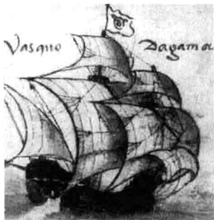
1-1 1498 年, 达·伽马首次率领船队远航印度。

15—17 世纪, 经历“文艺复兴”、走出中世纪的西方各国热情澎湃、野心勃勃, 充满探索、进取和冒险的精神。欧洲各国的船队在世界各处海洋航行, 努力寻找新的贸易路线和贸易伙伴, 开辟出一块又一块新殖民地, 获取了大量的财富和劳动力, 极大地推动了新生资本主义的发展, 这是人类历史上的“大航海时代”, 又称为“地理大发现”的时代。海洋成为西方列强全球拓土殖民的通道, 成为新兴资本主义原始积累的宝库。1487 年至 1488 年迪亚士 (Bartholmeu Dias) 到了非洲南端的好望角; 1492 年哥伦布 (Cristoforo Colombo) 发现美洲; 1498 年达·伽马 (Vasco da Gama) 率领船队绕过非洲的好望角到达印度, 这是近代欧洲人首次由新航路来到亚洲, 开辟了欧洲通往东方的航路; 1519 年至 1522 年麦哲伦 (Fernando de Magallanes) 船队完成了环球航行。16 世纪西班牙“无敌舰队”称雄海上, 17 世纪的荷兰号称“海上马车夫”, 18 世纪英国战胜西班牙、葡萄牙等海上强国, 最终掌握了海上霸权。新航路的开通、美洲的发现、环球航行的成功以及其他航海探险活动, 欧洲列强的海上争夺, 将世界联系成为一体, “全球化”的序幕得以开启。“大航海时代”对全世界的经济生活产生了巨大的影响, 世界市场拓展, 商品种类增多, 商业中心转移, 商业强国崛起, 商业革命勃兴。商业对新产品的需求导致 18 世纪工业革命在世界最强大的殖民帝国——英国出现。机器取代人力, 大规模工厂化生产取代个体工场的手工业生产, 科学技术发展突飞猛进。从某种意义上说, “大航海时代”成为人类社会现代化进程的起始, 开启了 18 世纪工业革命到来、现代设计发生的历史篇章。(图 1-1)