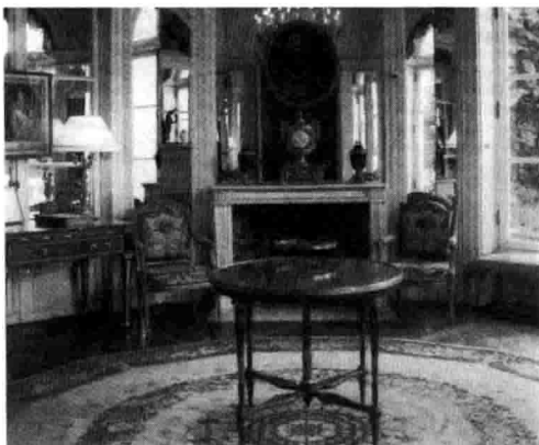
1-5 法国巴黎朗贝尔公馆客厅洛可可设计。