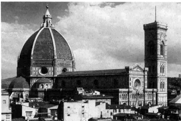
1-2 意大利文艺复兴时期建筑佛罗伦萨大教堂。

13 世纪到 16 世纪发生的欧洲文艺复兴具有鲜明的人文主义特色。新兴资产阶级通过文艺复兴运动标榜恢复希腊罗马的古典文化, 以求摆脱封建思想和宗教势力的束缚, 从鼓吹神性走向尊重以人为本, 人有权享受现世的快乐, 从而肯定了科学技术改变现实世界的力量。文艺复兴时期是杰出的思想家、哲学家、文学家、艺术家和科学家、工艺设计家辈出的时代。文艺复兴时代设计成就辉煌。文艺复兴作为思想文化的启蒙运动, 作为背弃中世纪宗教信仰的充满人文主义精神的艺术与设计活动, 迎合了新兴资产阶级的需求。文艺复兴的工艺与设计在很大程度上改变了中世纪的宗教性质, 有了越来越讲究实用的倾向, 呈现出庄重典雅、和谐含蓄、充满古典意蕴和世俗情调的面貌。(图 1-2) (图 1-3)