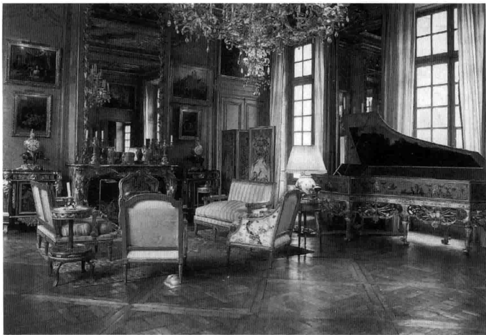
1-4 法国的巴洛克样式家具。