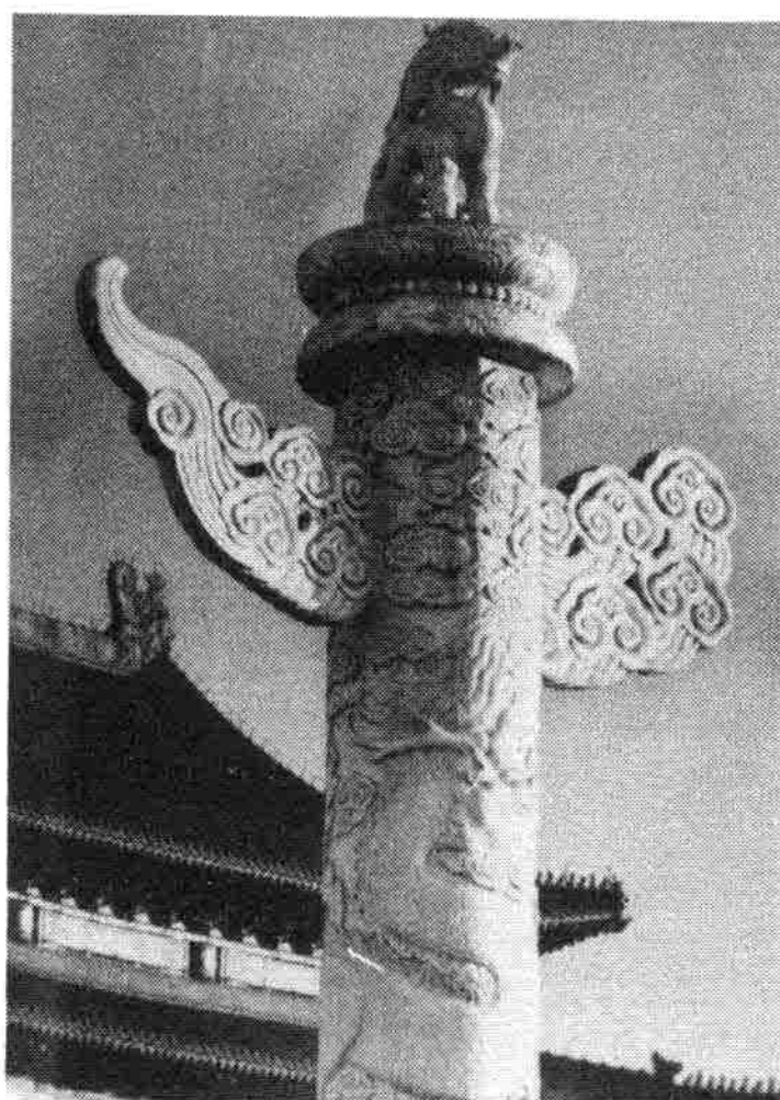
天安門華表上的承露盤 與望天獅