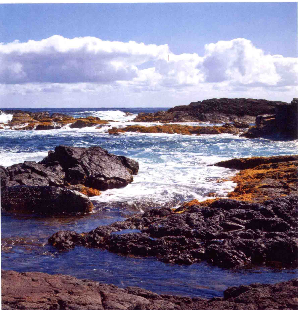
美国 夏威夷 Big Island (大岛) 2011年