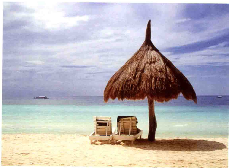
菲律宾 薄荷岛 2009年