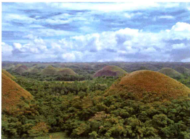
菲律宾 薄荷岛 巧克力山 2009年

那是5年前的一次海岛行，当时觉得所住的度假的村里那片海域已是我见过海水最清透、沙最细滑的了。我喜欢浅海那种淡淡的薄荷绿色，若有深浅层次所呈现出来的色差就更好了。躺在棕榈做的遮阳亭下，一阵热带海洋的微风吹起身后的椰树叶，沙沙作响，这场景突然让我想起20世纪90年代时家里的餐厅墙上挂的那幅海边椰树壁画，让人心情好极了。