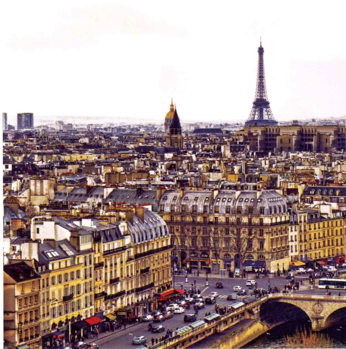
法国 巴黎 2012年