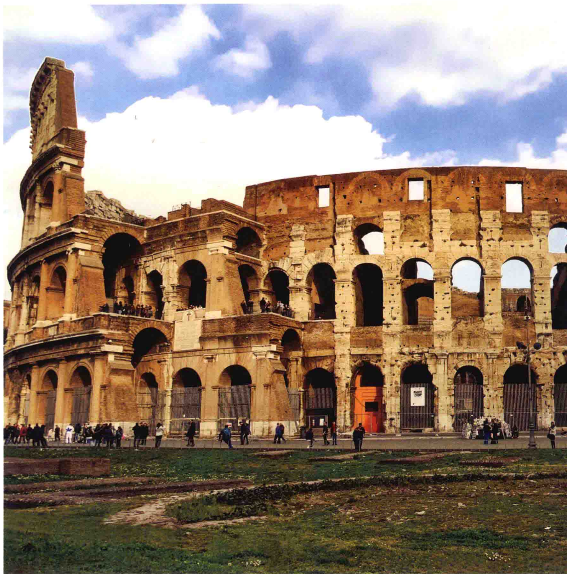
意大利 罗马 2012年