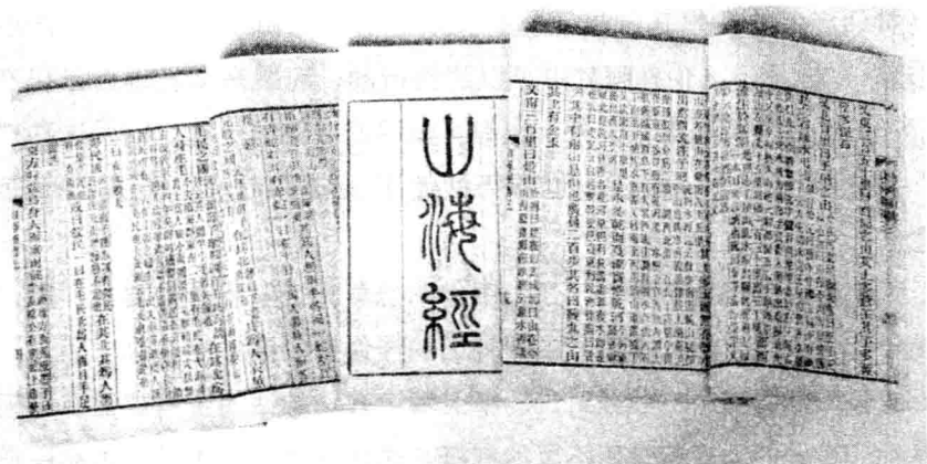
《山海经》是中国神话的一座宝库

毫无根据的。神话的内容所反映的仍是自然界和当时社会，只是这种反映不属于直接的、科学的反映，而是在原始人极其幼稚的观念支配下，通过幻想的方式曲折地反映出来的。一些十分生动、美丽的神话故事，在我们今天看来，是一种极富想象力的文学艺术作品，但对当时原始人类来说，却并非是一种有意识的艺术创作，而是他们对自然界和社会本身所作的自以为真实可信的描述和解释。它告诉我们，原始人类是如何不屈不挠地与强大的自然力进行英勇的斗争的，是如何对未来的世界充满了希望和美好的憧憬的。这种对未来世界的希望和憧憬，及由此而产生的幻想，对于他们那一时代社会生产的发展，以及对后世的人们，都成为一种推动和鼓舞力量。