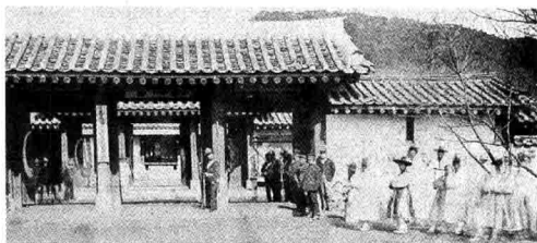
1.1.04 日军侵入江华岛，朝鲜地方官集体出迎。两国大臣在岛内这座庙堂，签署了朝鲜历史上第一个和外国的不平等条约，史称《江华条约》。图为朝鲜官员在迎候日本来使。

就是排除日本在朝鲜的势力，企图取得朝鲜周边的不冻港，建立俄国在远东的霸主地位。在错综复杂的国际背景下，日本陆军长老山县有朋向国会提交了一份军备意见书，指出俄国的西伯利亚铁道计划将在十年后完成，那时日本的假想敌将不再是清国而是俄国，日本必须抢在俄国人之前在政治和军事上确保对朝鲜的控制权。为达到这个目标，日本有必要在清国领地内设立据点，日本需要合理的理由在军事上打击清国的军事力量。