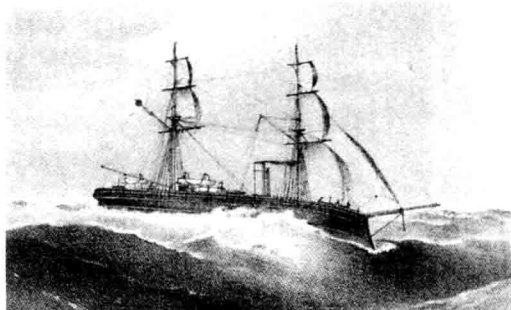
1.1.02 日本海军“云扬”号，公然闯入江华岛湾，测量朝鲜沿海水文，朝鲜守军奋起炮击，遭到云扬舰炮的还击，摧毁了江华岛炮台。1876 年朝鲜被迫与日本签订了不平等条约《江华条约》。

罪。清国政府为了平息日本和朝鲜间的紧张局势，将大院君押送清国软禁。日本政府则迫使朝鲜政府签订了《济物浦条约》，要求朝鲜向日本赔偿 55 万日圆损害金，允许日本派 1,000 名警卫驻扎朝鲜，保护日本侨民和公使馆。事件虽然就此平息，但是清国警觉日本驻军朝鲜的目的，急速从本土增调 3,000 人的兵力开进朝鲜，向日本施加压力，两国军队因此形成了对峙的强弩之势。“壬午兵变”导致朝鲜宫廷完全倒向清国，日本在朝鲜处于被冷淡的境地。