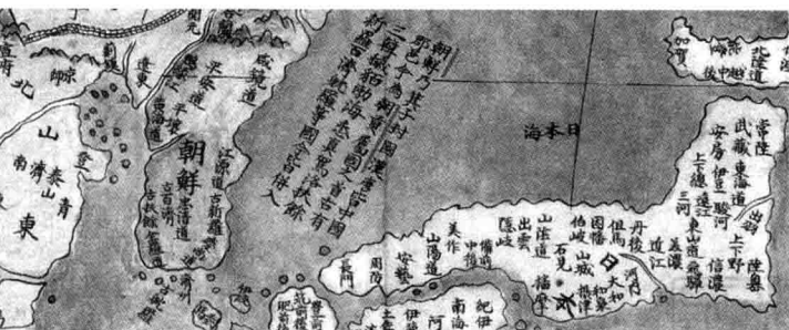
1.1.01 明朝绘制的属国图，朝鲜并入明朝版图。图中注明：“朝鲜乃箕子封国，汉唐皆中国郡邑，今为朝贡属国之首。古有三韩、秽貊、渤海、悉真、驾洛、扶余、新罗、百济、耽罗等国，今皆并入。”