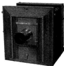
日清战役从军摄影器第一号 龟井家