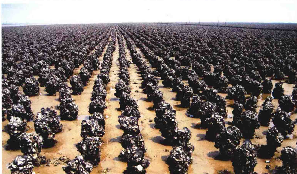
茅尾海东北部 大蚝养殖区