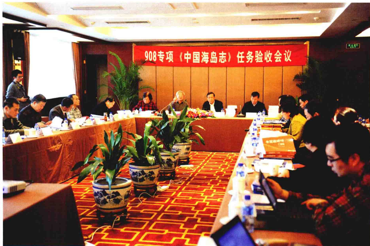
908专项《中国海岛志》任务验收会议