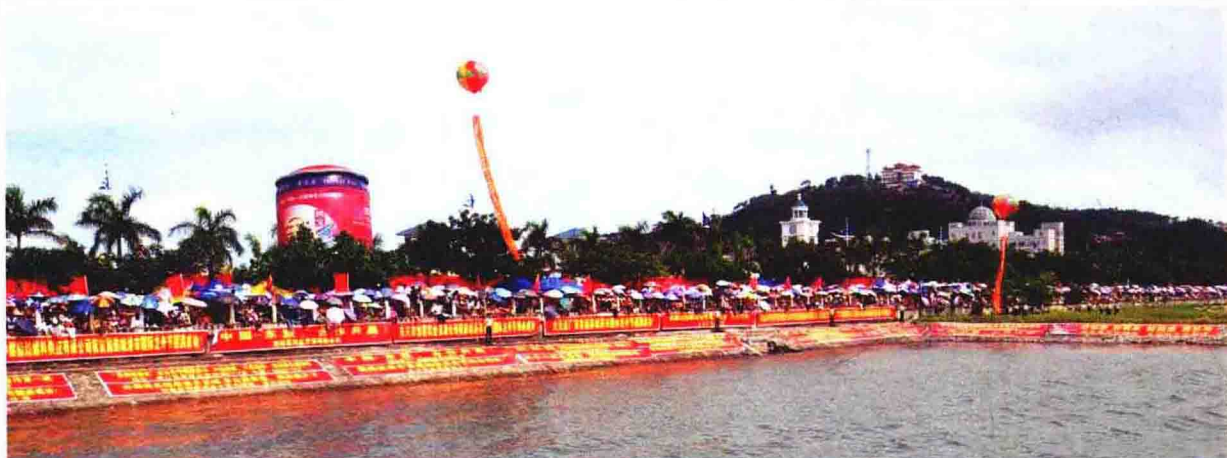
扮靓的防城港西湾喜迎国际龙舟节