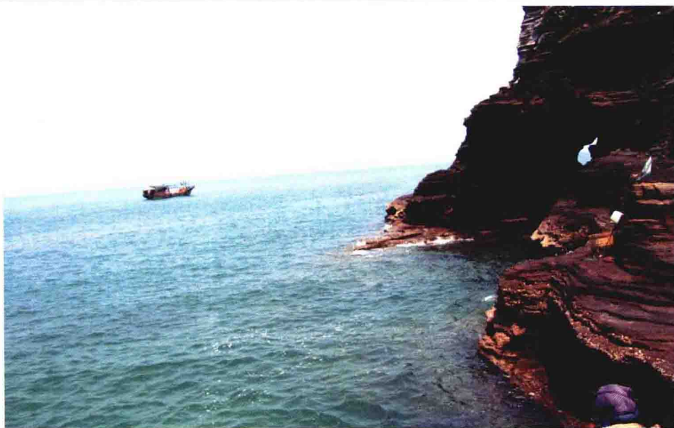
斜阳岛东北部海岸 石象饮水图