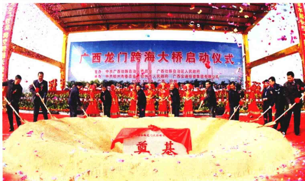
北部湾标志性建筑 龙门跨海大桥盛大开工