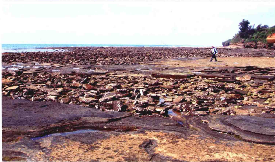
涠洲岛南湾东口的芝麻滩