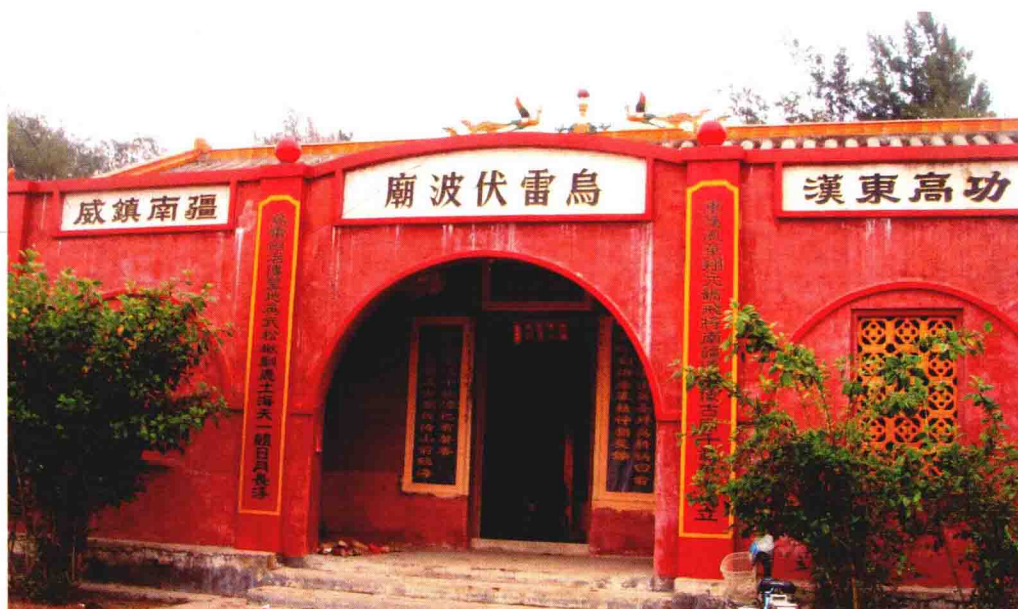
钦州湾东岸的 乌雷伏波庙