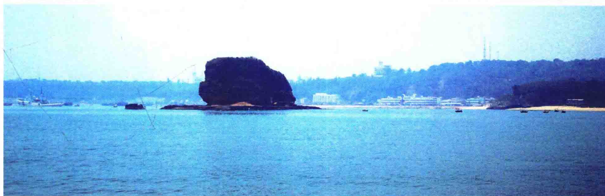
涠洲岛南湾龟豚拱碧胜景