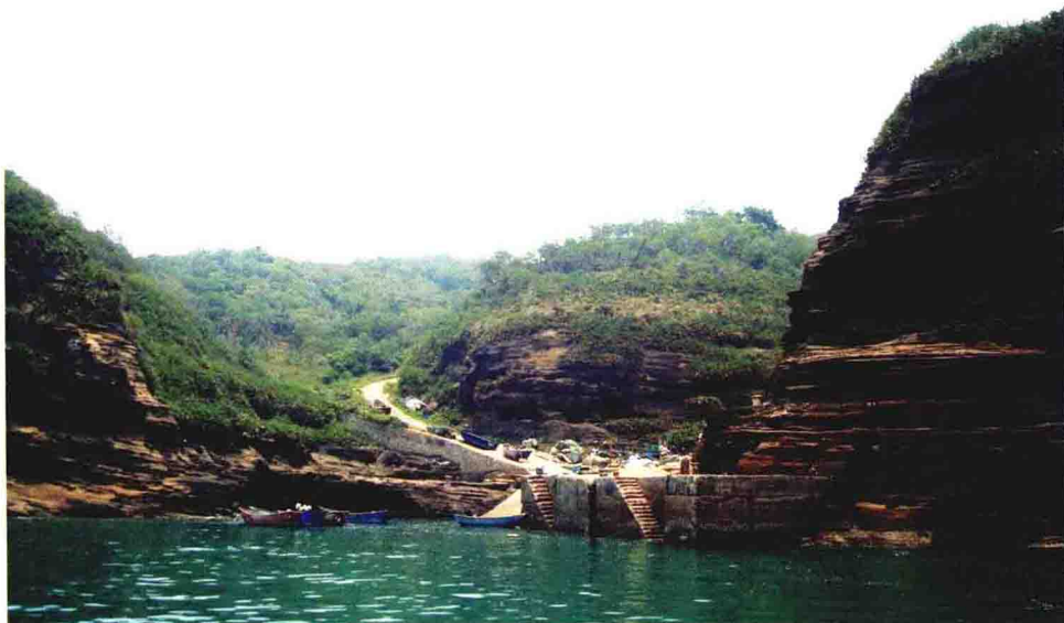
斜阳岛西北部灶门湾码头