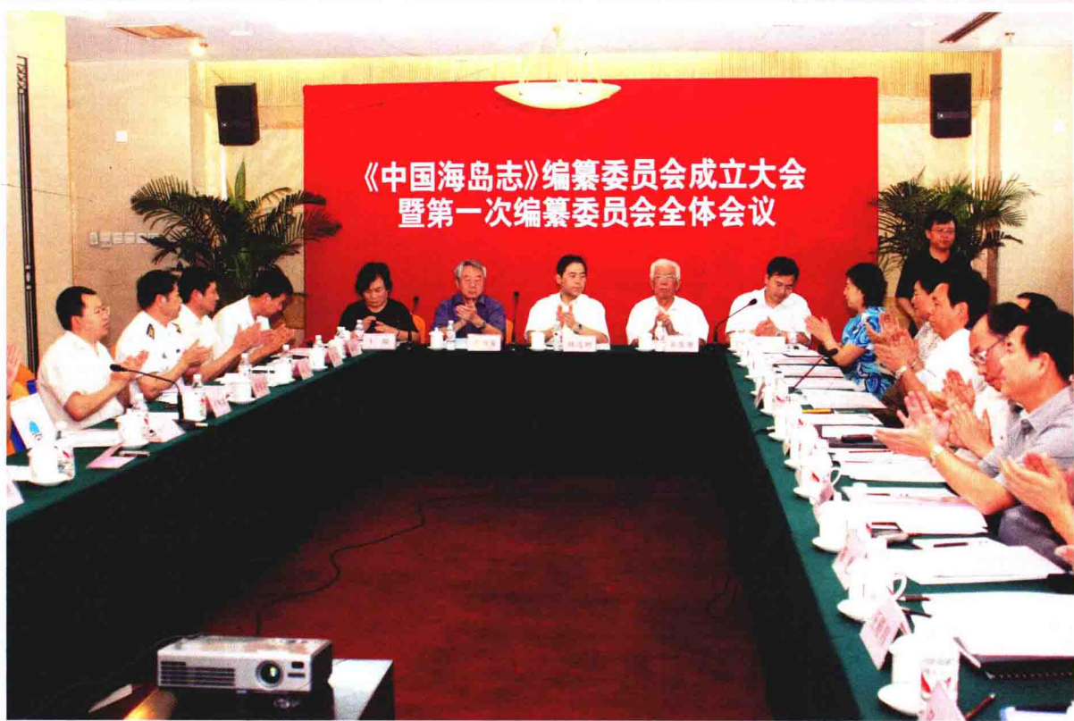
《中国海岛志》编纂委员会成立大会暨第一次编纂委员会全体会议