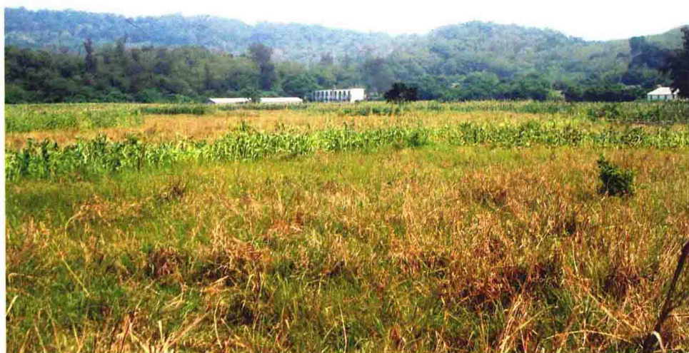
葱翠环抱的斜阳岛村落