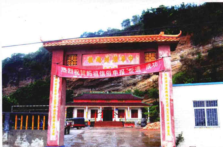
涠洲岛南湾码头附近的妈祖庙