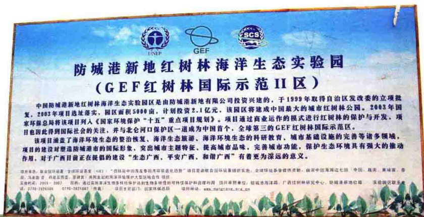
渔沥岛东部红树林 海洋生态实验园