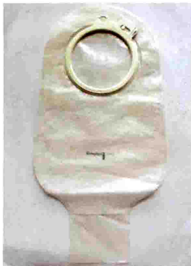
图 29-18 两件式人工肛门袋 (肛门袋)