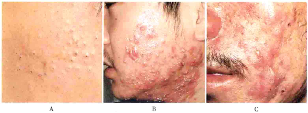
图 56-1 痤疮 A. 粉刺; B. 丘疹、脓疱; C. 囊肿、结节