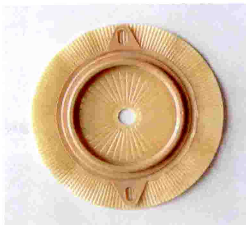
图 29-17 两件式人工肛门袋 (底盘)