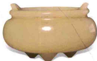
黄玉小炉 成交价: RMB 8,050