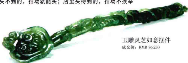
玉雕灵芝如意摆件 成交价: RMB 86,250