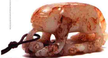
白玉带沁云纹虎坠 成交价: HKD 46,000

玉器市场水很深，不读本书千万别进场买货 店里买不到的，拍场就能买；店里买得到的，拍场不挨宰