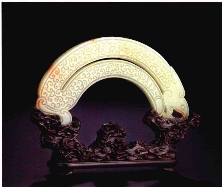
青白玉仿古雕龙形璜

An Archaic Arc-Shaped Jade Pendant, Huang 西周 W.Zhou PLHK 保利香港 2013-4-7 Lot798 L 11cm 估价: HKD 300,000-500,000 成交价: HKD 460,000 (RMB 368,920)