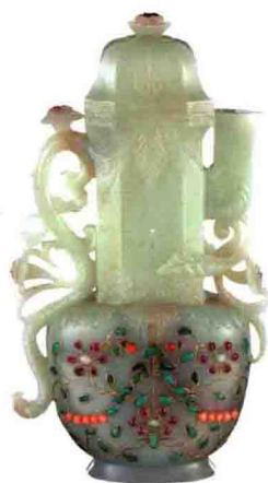
痕都斯坦式白玉嵌宝“苕苕花”纹盖壶 成交价: HKD 1,240,000

38家世界顶级拍卖行 356场重要玉器拍卖专场 覆盖全球所有拍卖重镇、各大拍卖行典型拍品 Top800收藏者必知的顶级高成交价玉器 Top200“白菜价”级捡漏玉 从一千元到数千万元 各档玉器拍品全收录 玉器爱好者、收藏投资者、从业者每年必备书 《拍卖年鉴》编辑部/编著