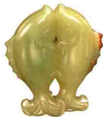
褐皮黄玉“年年有余” 成交价: GBP 50,000

玉器市场水很深，不读本书千万别进场买货 店里买不到的，拍场就能买；店里买得到的，拍场不挨宰