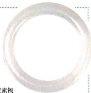
白玉雕素镯 成交价: RMB 32,200