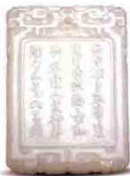
白玉许浑诗句佩 成交价: HKD 1,120,000