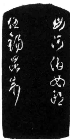
□ 母河伯女郎(附边款)