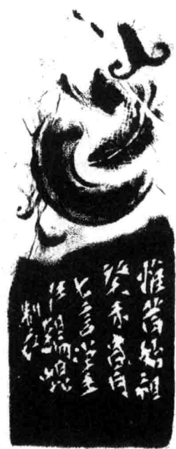
□ 惟昔始祖（附封泥边款）