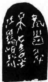
□ 龙首升天（附封泥边款）