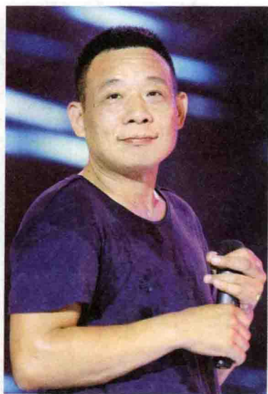
和员工在一起的“东来哥”