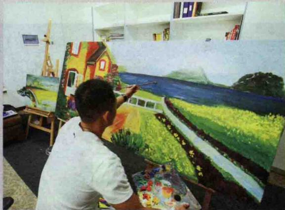
许昌胖东来时代广场员工活动中心的 休闲设施一应俱全