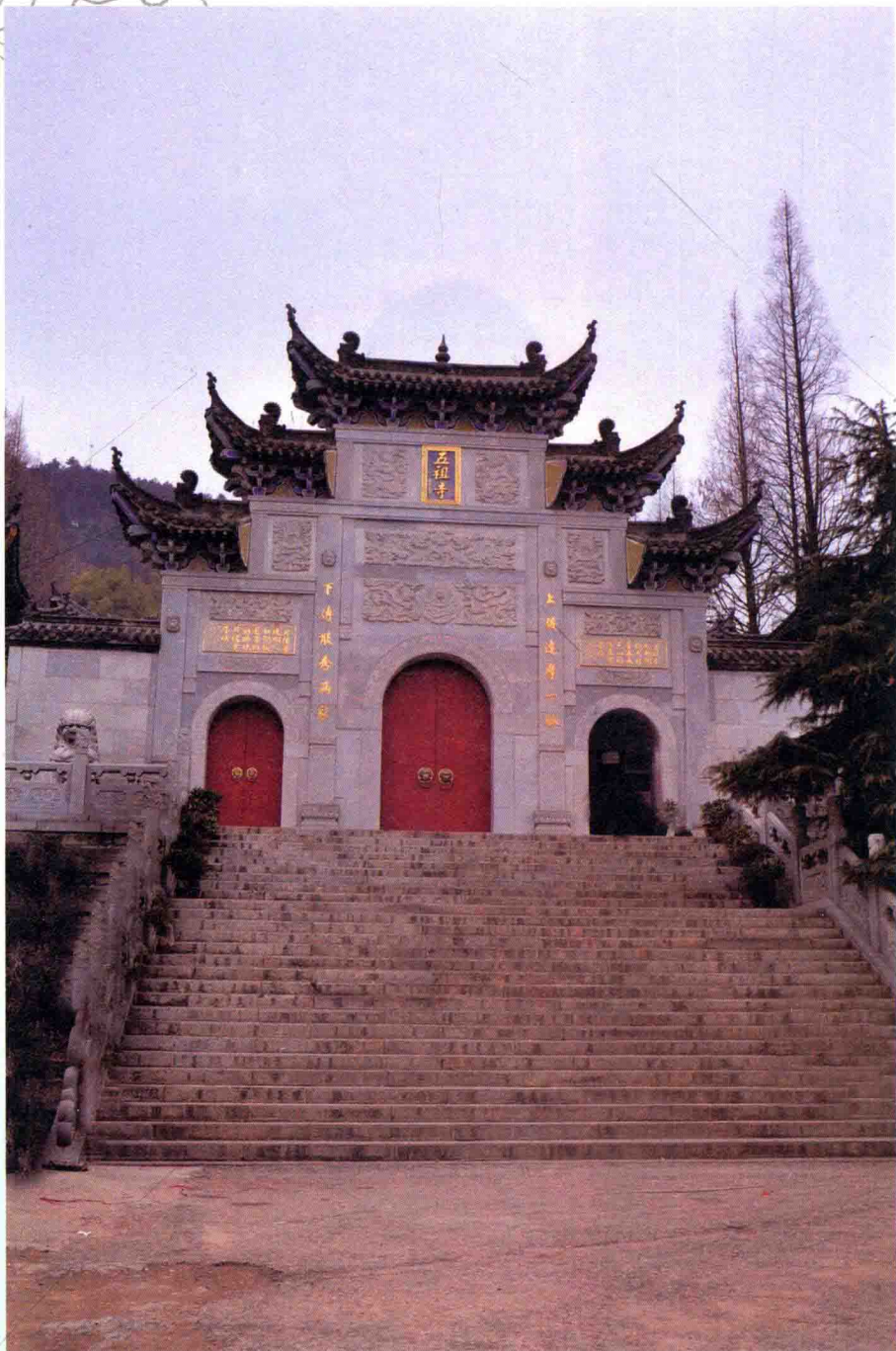
六祖祖庭之一：湖北省黄梅县五祖寺（唐代 东山寺）