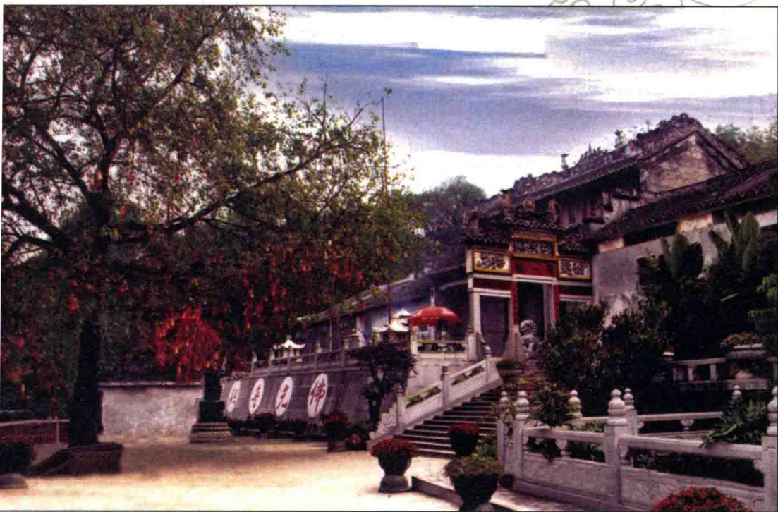
六祖祖庭之四：广东省新兴县龙山国恩寺