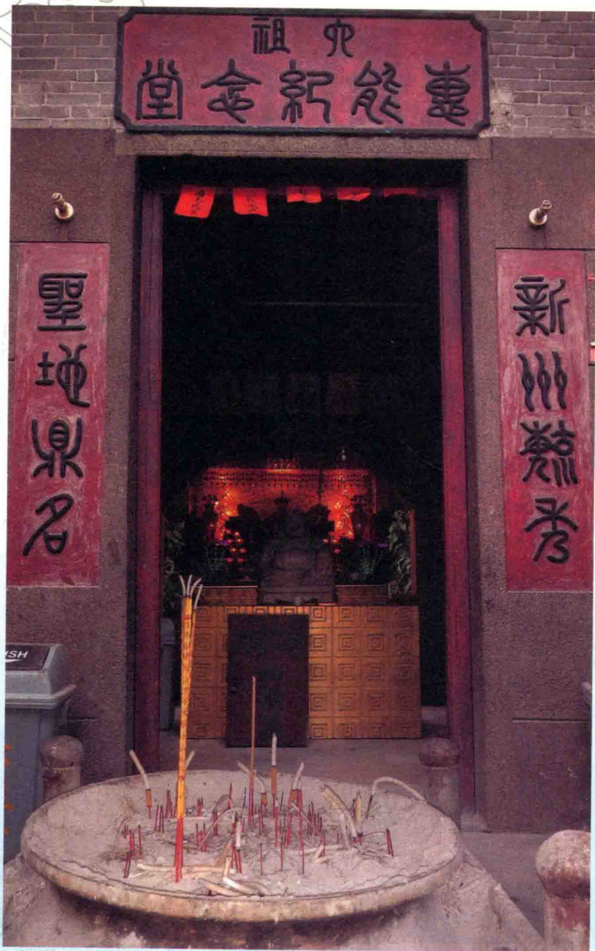
惠能出生地——岭南新州索卢县夏卢村（今广东省新兴县）