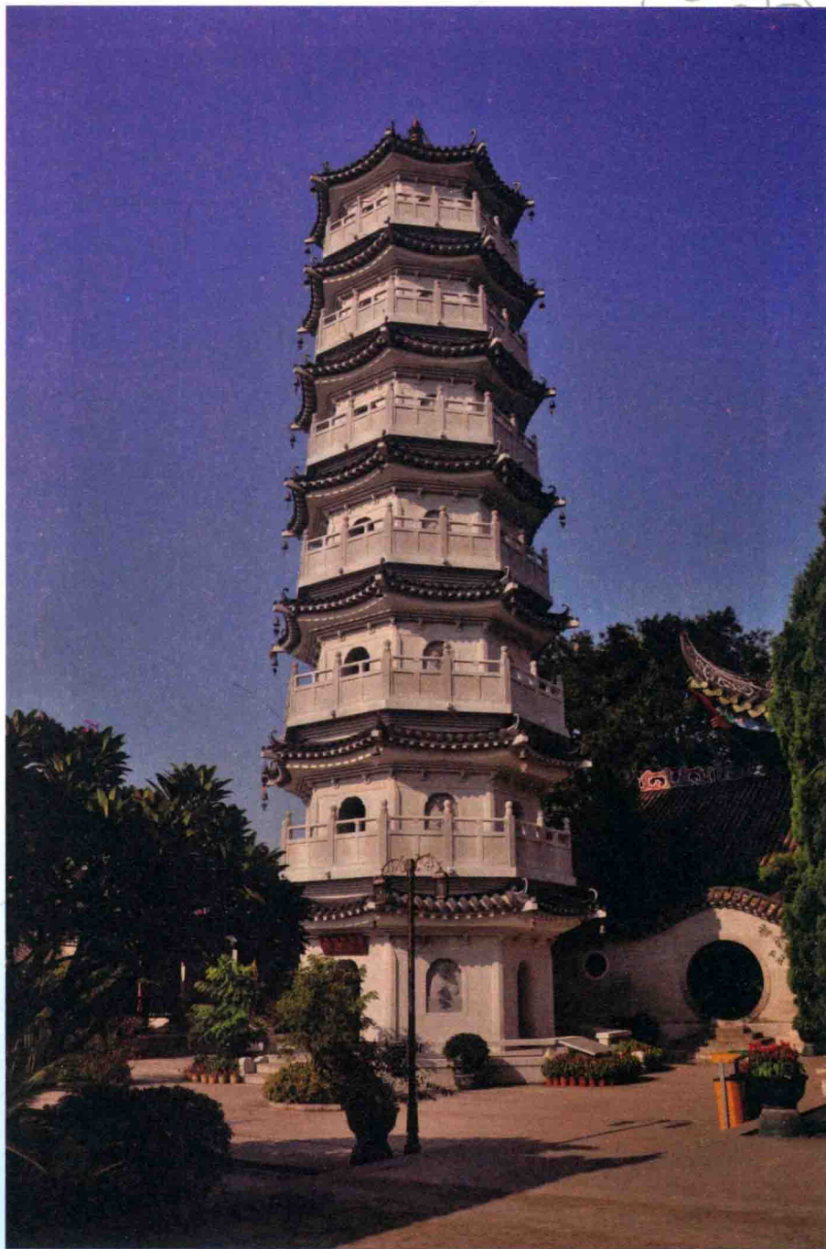
广东省新兴县龙山国恩寺报恩塔