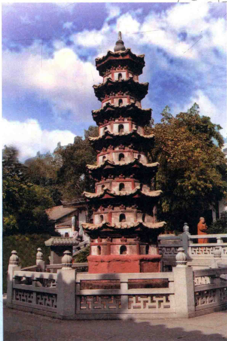
六祖祖庭之二：广东省广州市光孝寺（唐代 法性寺） 图为光孝寺内的瘞发塔，塔内埋有惠能当年剃度时留下的头发。