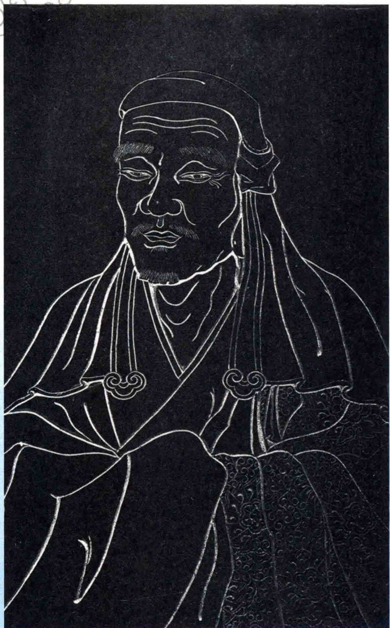
六祖惠能大师石刻像 [唐代]