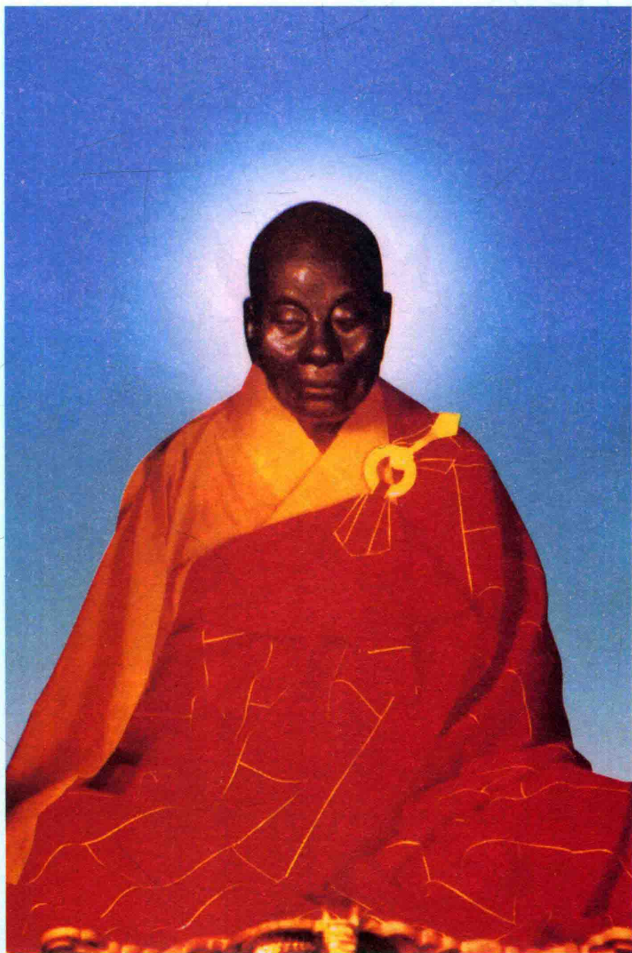
六祖惠能大师真身像