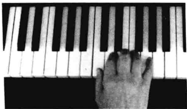
图 9-1 预备姿势