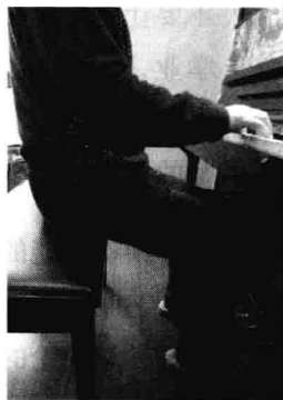
图 1-3 臀部坐在琴凳上,腿部在琴凳外