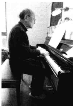
图 1-1 坐的姿势