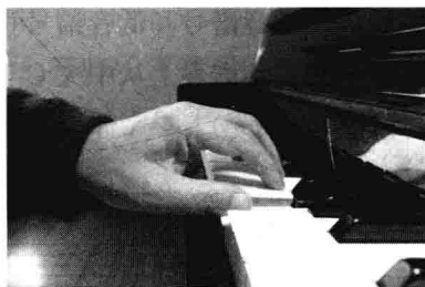
图 7-2 恢复预备姿势