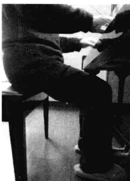
图 3 脚跟着地