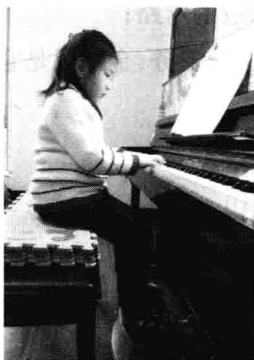
图 1-2 儿童的坐姿