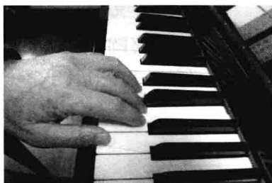
图 8-1 手指的发音点