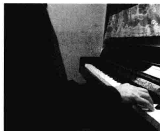
图 4 琴凳与钢琴的距离