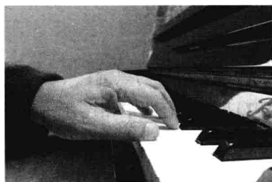
图 6 手腕的高度