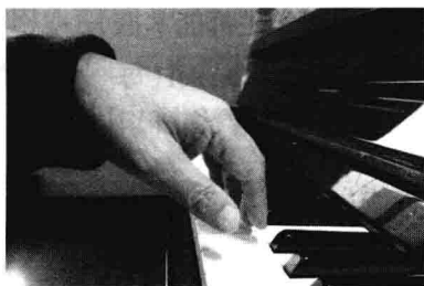
图 7-1 手腕带动手指离键