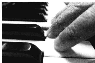
图 8-2 3 指要靠近黑键