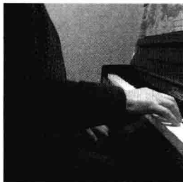
图 2 小臂与琴键平行