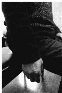
图 5 双手自然下垂所形成的手形