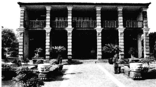
图2 利济医学堂经典砖木结构主屋建筑风格

学堂部分占地700 m 2 ，由门屋、东西厢房和主楼组成。门屋建于清光绪十一年，砖木结构，五开间，面阔16.25 m，进深两间共6.13 m。结构形式为梁架抬梁式，五架梁，屋顶为硬山造，梢间落翼（地方做法，即梢间高度比中间稍低）。门屋正南面砌墙，明间设台门，台门有青石门框，高5.10 m，宽4.44 m。台门顶部做成如意头，湿水做法，曲线优美，具有浓郁的瑞安地方特色。台门门额上嵌有孙衣言楷书刻写的“利济医院”青石匾。门屋的北面檐柱置柱头科，二跳五踩，偷心造，异形拱。厢房砖木结构，三开间，面阔15.65 m，进深四间，深5.50 m，梁架穿斗式，七檩分心，前后单步梁用五柱，上部草架。屋顶硬山造，檐柱置柱头科，一斗三升。