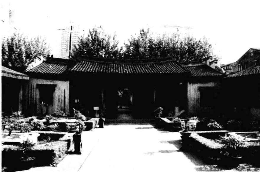
图1 利济医学堂清丽整洁的前院

利济医学堂整体建筑群坐北朝南，占地面积2 000 m 2 ，平面布局呈中国传统的四合院式。建筑群南北分为两个部分，依次为学堂和种植药物园。建筑群的单体建筑中西结合，体现了创建者鲜明的改良思想，以及对我国封建办学制度从内容到形式的强烈的改革要求。