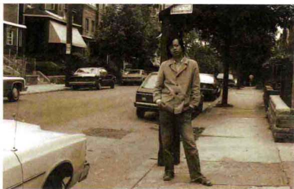
1985 年赴美国南部旅游途中