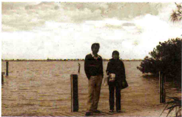
1985 年赴美国南部旅游途中