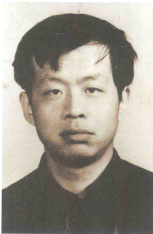
1978年中国人民大学学生证证件照