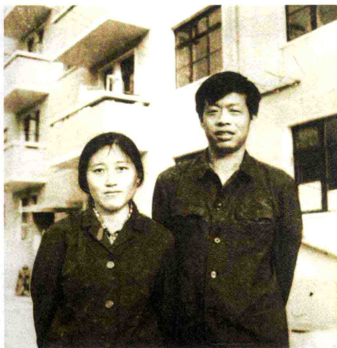
1980年初婚时于人民日报宿舍楼前