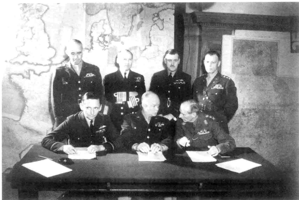
1. 盟军指挥官在 D 日前的合影：（前排）特德、艾森豪威尔和蒙哥马利；（后排）布雷德利、拉姆齐、马洛里和比德尔·史密斯