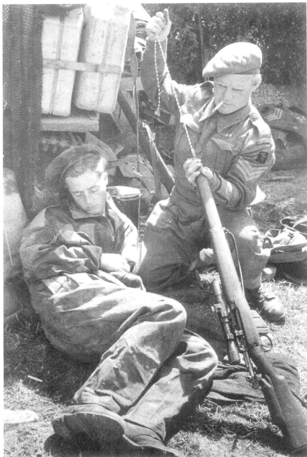
15. 东约克郡团的一名中士在清理一支狙击步枪，另一名士兵在睡觉