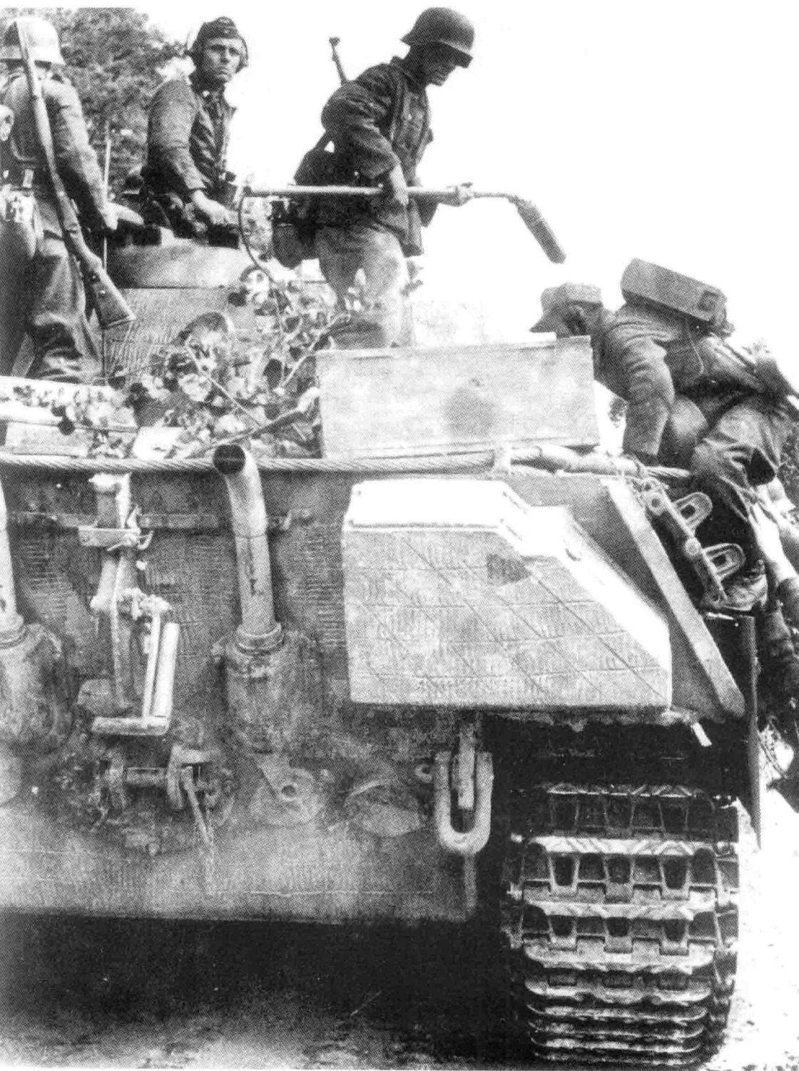
18. 拿着地雷探测器的德军装甲掷弹兵轻工兵站在一辆豹式坦克上