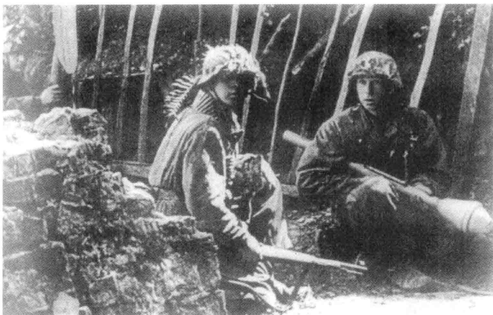
19. 拿着毛瑟 98 式步枪和肩扛式火箭炮的武装党卫军装甲掷弹兵