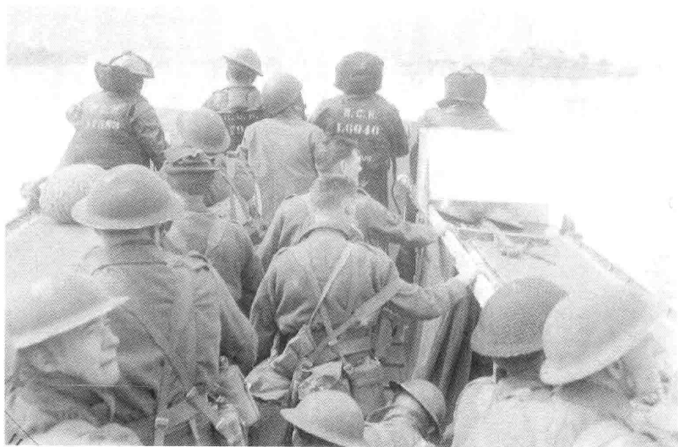
6. 6月6日，一艘正驶向朱诺海滩的加拿大皇家海军登陆艇