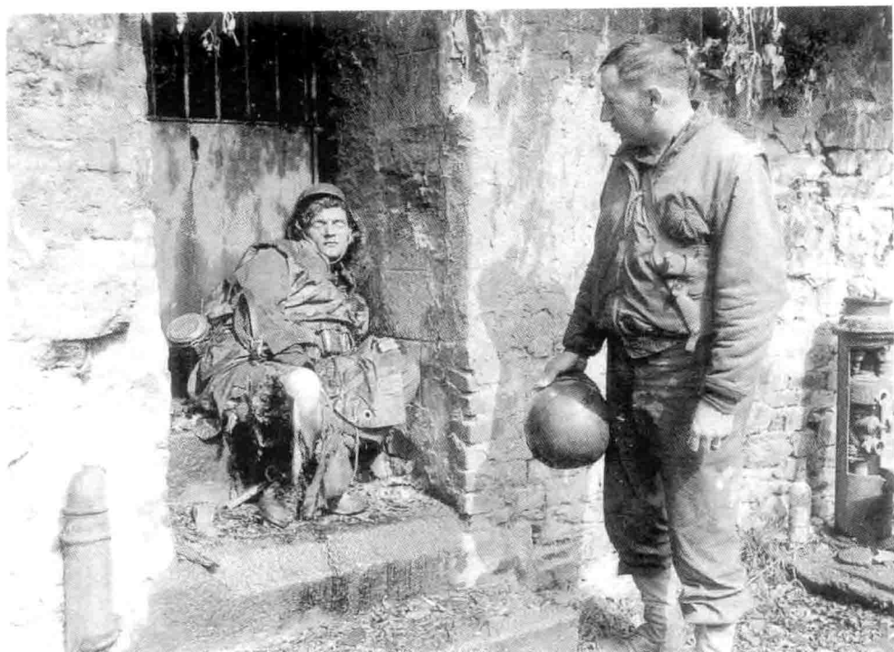
16. 6月27日，瑟堡郊区，一名美军士兵和一名死去的德军士兵