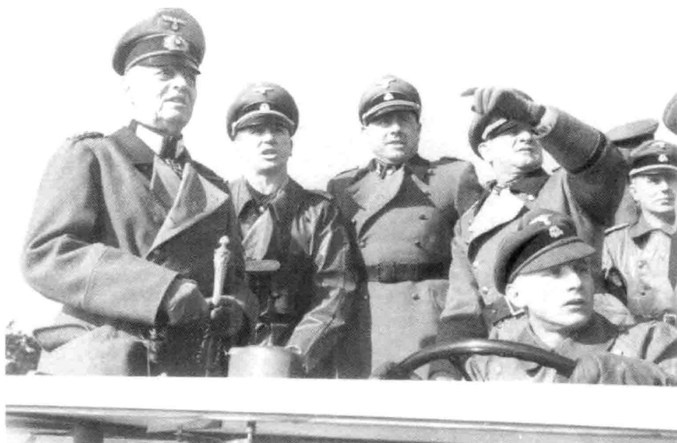
2. 伦德施泰特元帅视察党卫军第 12 装甲师“希特勒青年团”：（从左到右，站立者）伦德施泰特、库特·梅耶、弗里茨·维特和党卫军第 1 装甲军的泽普·迪特里希