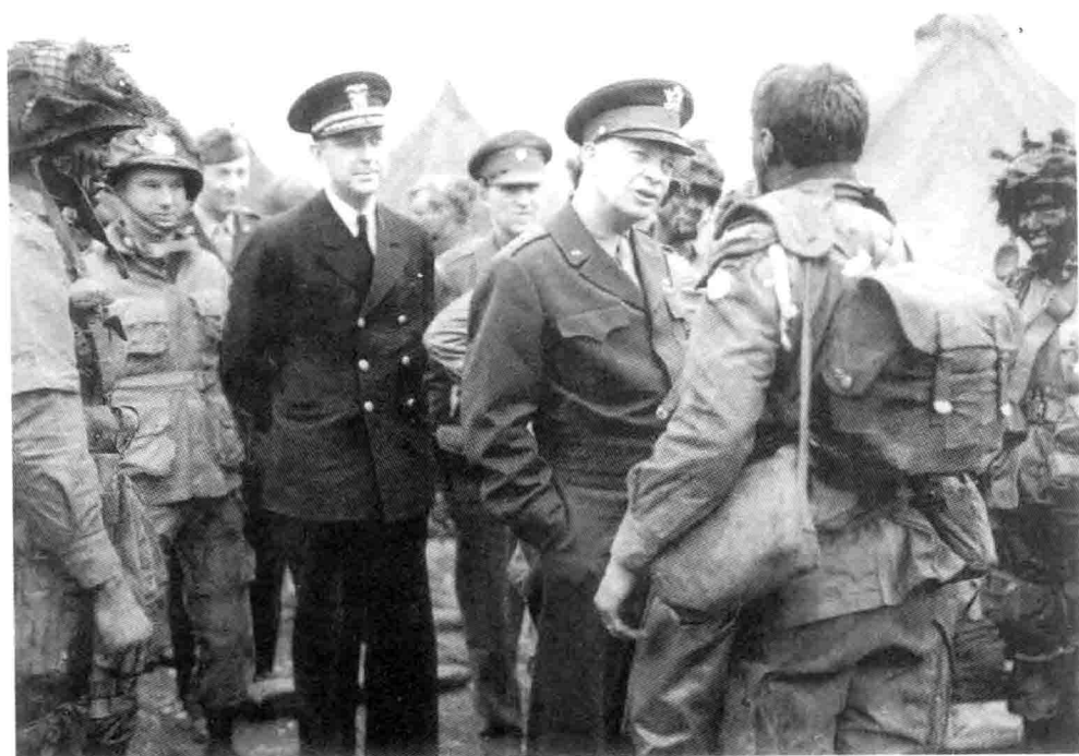
4. 6月5日，格林汉姆公地，艾森豪威尔在第101空降师出发前和该师士兵一起。艾森豪威尔身后是他的副官哈里·布彻