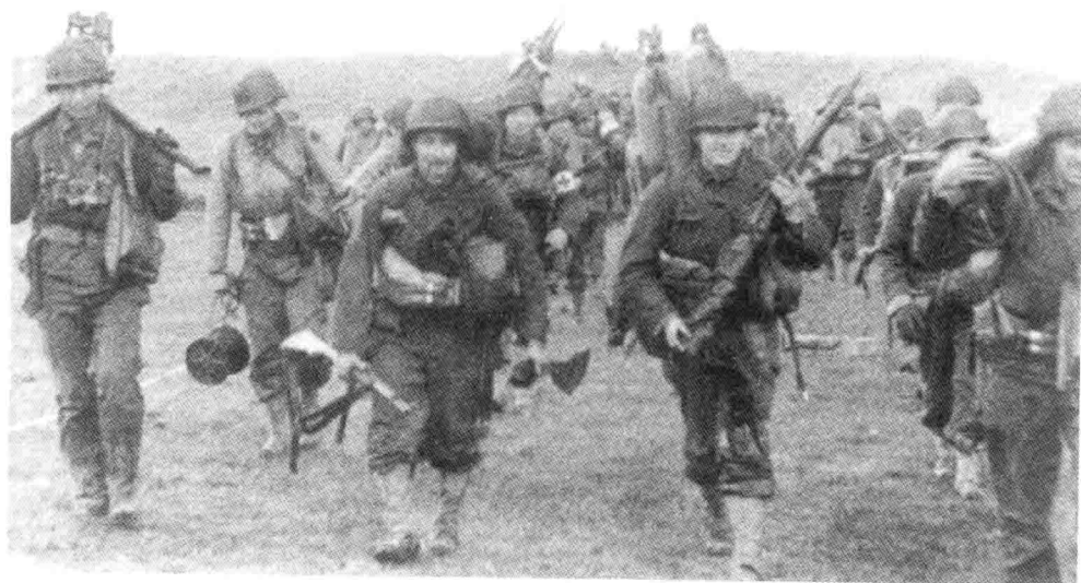
9. 第4步兵师的部分队伍从犹他海滩向内陆推进