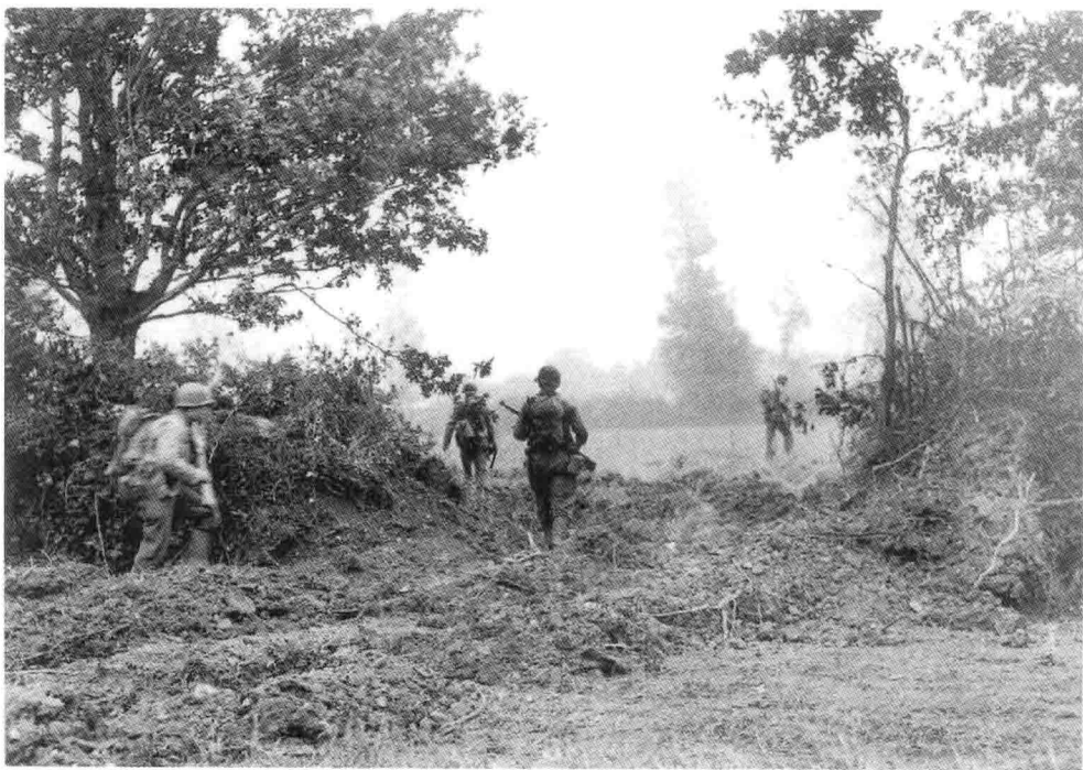
20. 美国步兵从“犀牛”坦克在农庄的灌木篱笆上打开的缺口处穿过