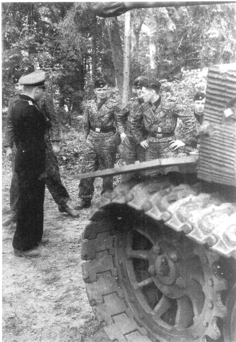
14. 来自东线的党卫军第 101 重型坦克营的德军“坦克王牌”迈克尔·威特曼（后方中间）和他的炮手巴尔塔扎·沃尔（双手叉腰）