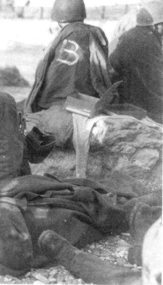
7. 奥马哈海滩上，美军卫生员给一名伤员输血