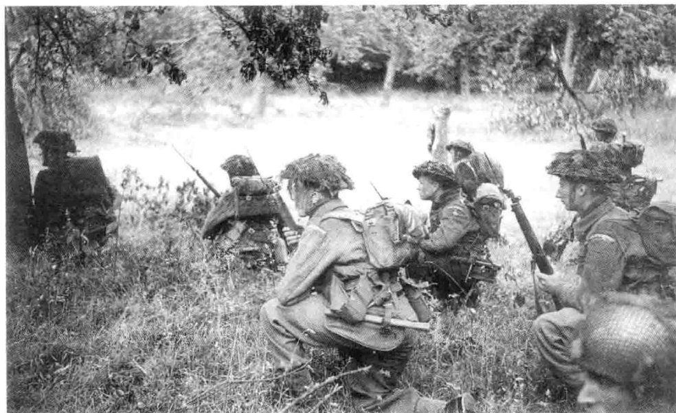
17. 6月26日，“埃普索姆行动”的起始点，第6皇家苏格兰燧发火枪团（第15师）