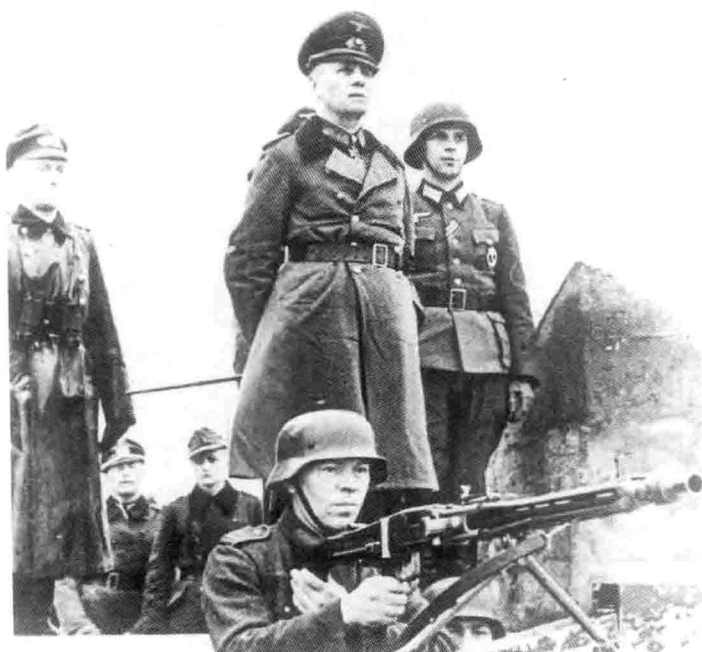
3. 隆美尔视察大西洋堡垒