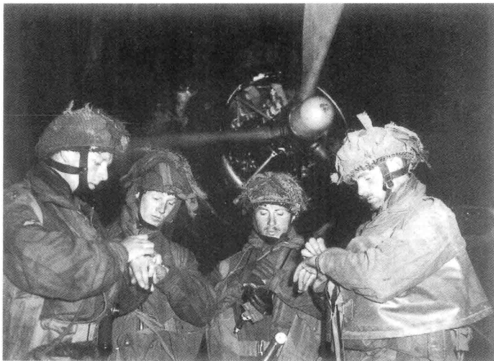
5. 第6空降师的探路小组成员在出发前对表