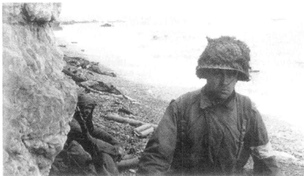
8. 奥克角的悬崖下，一名卫生员和受伤的游骑兵们