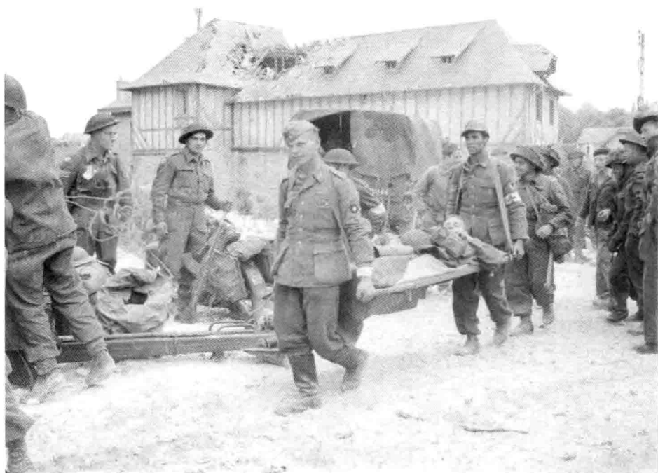
11. 加拿大军队俘虏的德国战俘将一名伤员抬回朱诺海滩