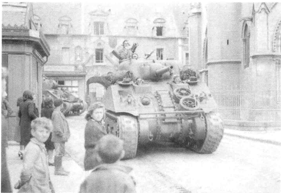
12. 第2集团军的一辆谢尔曼坦克驶过卡昂北部的杜弗拉德利夫朗德