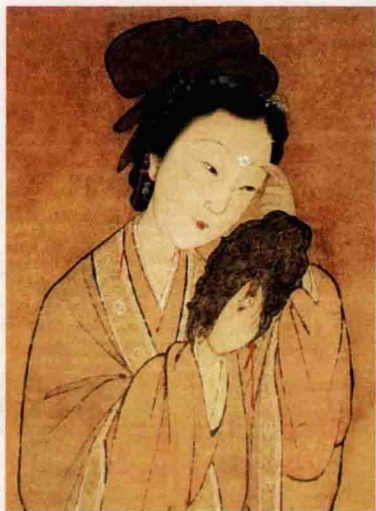
元人《梅花仕女》（局部）

不久，“梅花妆”又流传到民间，并受到了女孩子们的格外钟爱，特别是那些官宦大户人家的大家闺秀以及歌伎舞女们，更是争相仿效，以为时尚。但梅花不是四季都有，女人们就用很薄的金箔剪成花瓣形，贴在额上或者面颊上，称为“梅花妆”或“寿阳妆”。从此以后，“梅花妆”饰面成为由宫廷至民间千年不衰的时尚妆容，频频出现在吟咏