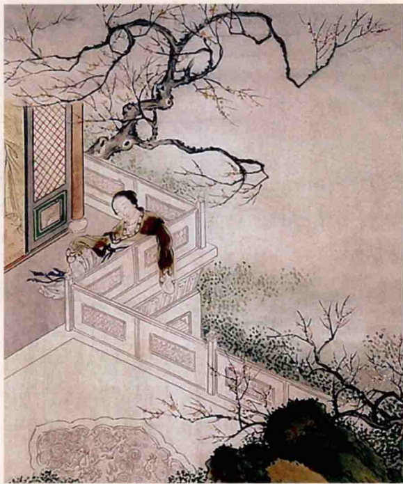
《妆楼图》（局部） [清]王素 作

公主的名字永久地留在了暗香浮动的梅林间，民间传说寿阳公主是梅花精灵所化，梅花本来就是寿阳公主的前身。于是，人们把正月初七定为梅花生日，寿阳公主则为梅花花神。清代著名学者俞樾《春在堂全书·曲园杂纂·十二月花神议·议之下》（以下简称《十二月花神议之下》）中就十分赞同这一看法，力主将寿阳公主奉为正月梅花女花神。有诗说：“一树开来冰雪香，谁家新拭岁寒妆？时人不识桓伊曲，信指花神是寿阳。”