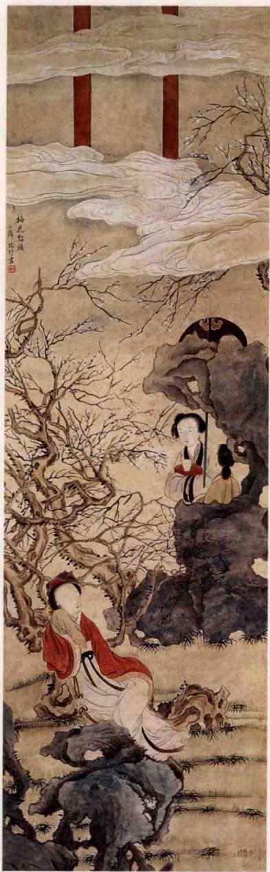
《梅花点额》 [清]改琦 作

闺阁风情的诗词歌赋之中，成为一道娇美靓丽的风景。古代文人十分喜爱这个富有诗意的故事，诗词歌赋里不断重现这个情境。