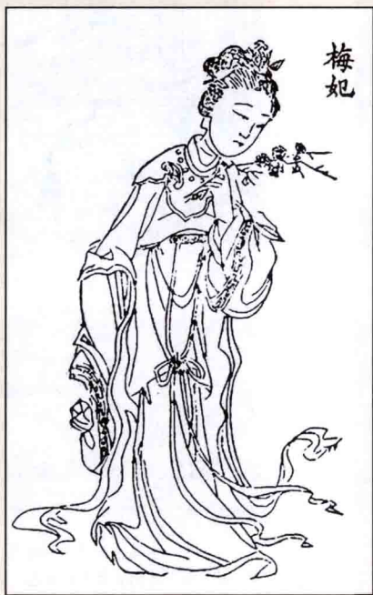
《历代百美图》（明刻）之梅妃