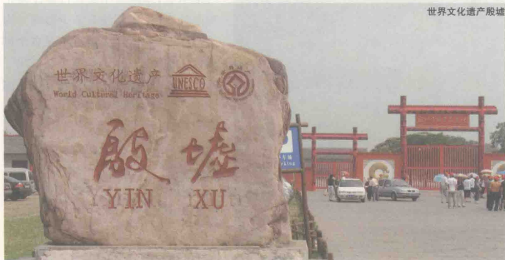
世界文化遗产殷墟

在早商的历史上，由于王室内部的权力之争，新王即位时，曾多次出现采取迁都的办法，一方面摆脱王族争权夺利的状况，另一方面为了找个更合适的地方营建自己的势力，加强对诸侯、方国的控制。盘庚继位后，也面临着国势衰弱的复杂局面。王朝统治危机四伏，内部矛盾斗争激烈，由于商的王位继承制是兄终弟及和父死子继并存，还不是严格的传子制，因此每当一位商王去世，都会引起一场争夺。这一问题长期没有得到解决。王室之争使得诸侯、方国乘机发展自己的势力，不再向王朝进贡。盘庚即位时，发生了彭、韦二方伯的叛乱，北方和西北方的土族、羌族也日益强大，