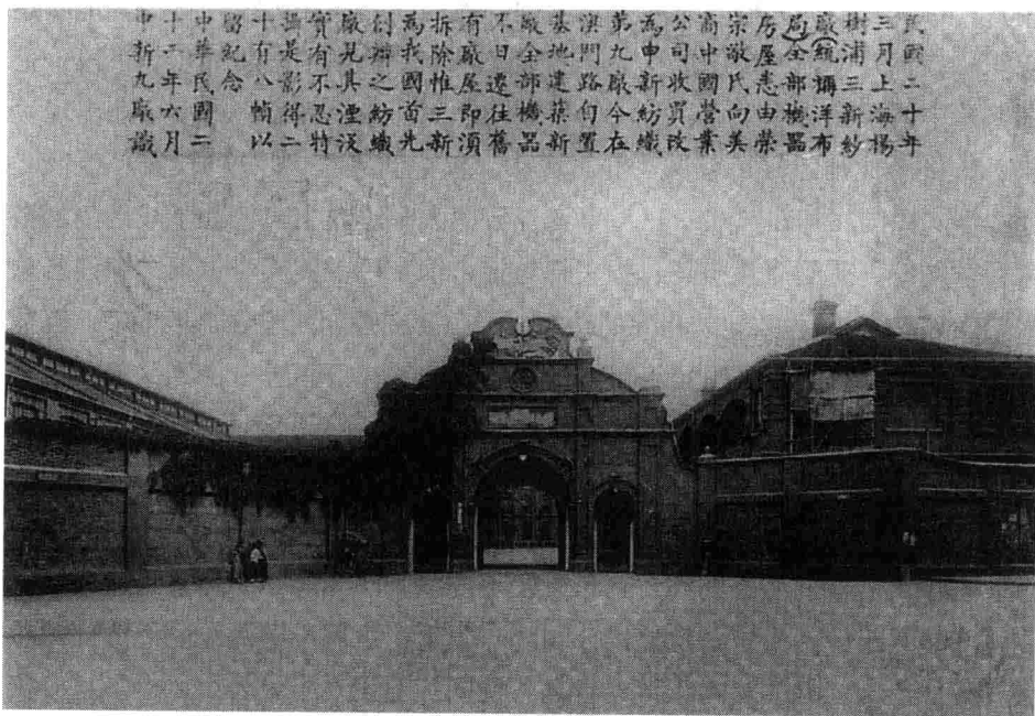
三新纱厂(上海机器织布局旧址)

1895年(清光绪二十一年)马关条约签订后,列强获得在中国通商口岸设厂的特权,外资纷纷进入上海纺织业。1896~1897年(清光绪二十二、二十三年),美商鸿源纱厂和德商瑞记纱厂,英商老公茂、怡和纱厂相继在上海开工。1902~1912年(清光绪二十八年至民国元年)间,日商也先后在上海开设上海纺织、内外棉和日信3家纺织厂。到第一次世界大战前夕,外商在上海共拥有棉纺锭33.9万枚,织布机1986台,占上海棉纺锭总数的70.50%。英商最多,日商次之。