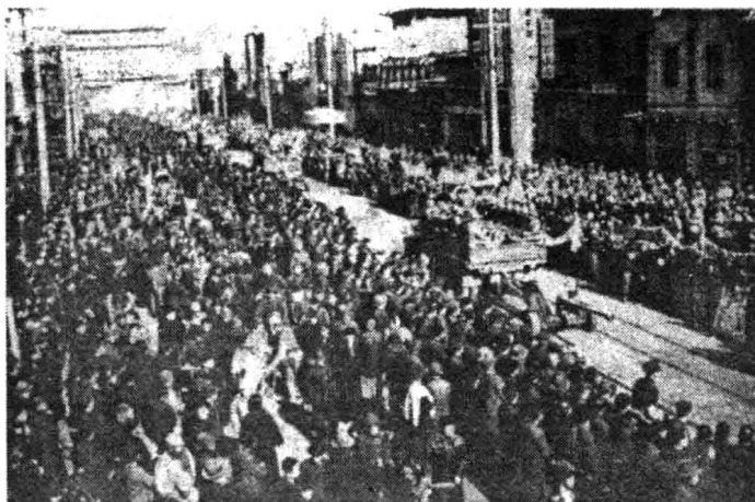
炮兵部队通过前门大街

象。三大战役结束后，解放了的东北、华北和长江中下游以北广大地区，已连成一片，总面积达261万平方公里，占全国总面积的27%；总人口约2亿，占全国总人口的42%。经过清匪反霸和土地改革运动的解放区，人民生产、支前的积极性空前高涨，工农业生产迅速恢复和发展，交通运输日益畅通，财政经济有了增长，社会秩序安定，市场贸易活跃。分得土地的广大农民群众热情地支援前线，参军参战，保卫胜利果实。