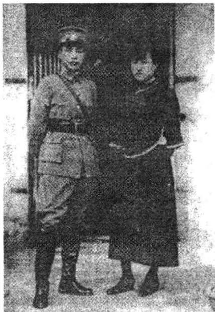
1926 年蒋介石与夫人陈洁如

透露，白宫方面“与对外政策有关的人士”认为“委员长”应该让位于别人，只要他在一天，美国便不会为中国做什么事。美国国务院也一再放出风声，只要蒋在位，不可能指望美国增加援助。