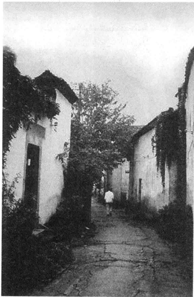
杭州蔡官巷。林徽因出生在距此不远的陆官巷,5岁时随祖父母移居蔡官巷,8岁时随祖父由杭州迁居上海。