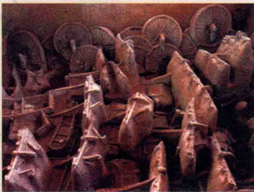
河南新郑市李家楼春秋时期郑公大墓车马坑遗迹

郑国是周厉王幼子姬友（郑桓公）的封国，始封地在今陕西凤翔、华县一带，在西周将亡之际，东迁至今河南新郑一带。郑国国土虽然不大，但由于地处中原中心，北靠黄河，西连周王室，交通便利，经济发达，郑伯又是周王室的卿士（执政官），地位特殊，春秋初年，在齐、晋、楚等国没有强大起来之前，周边小国都怕它。