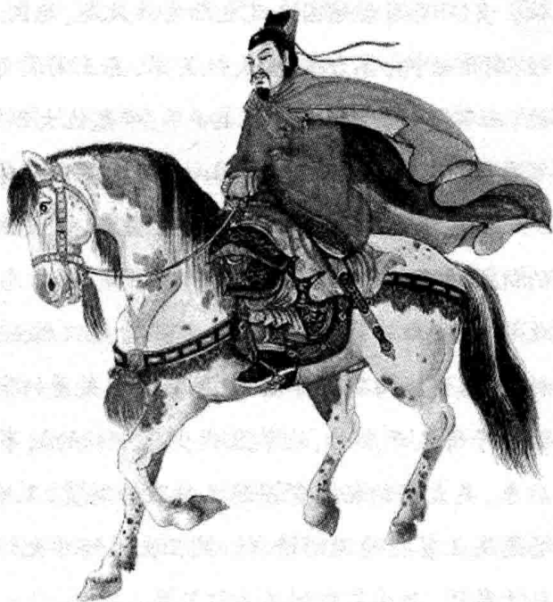
范蠡(前536-前448)字少伯,号陶朱公,楚国宛(今河南省南阳市)人,春秋末期越国上将军,被誉为“中国商圣”