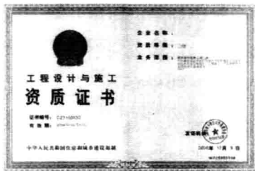
图 1-3 资质证书

资质是建设行政主管部门对施工队伍能力的一种认定，主要是从注册资本、技术人员结构、工程业绩、施工能力、社会贡献等方面对施工队伍进行审核，分别核定为一至四级。取得资质的企业在技术方面有保证，从事家庭装修一般不会有问题。但是，由于家庭装修市场的混乱，拥有资质等级特别是拥有高资质等级的单位不愿承接一般的家庭装修；而营业执照、营业范围内有装饰装修项目的企业，大部分又没有到建设行政主管部门办理资质。这种状况给业主判别家庭装修施工队伍的好坏带来了很多困难。