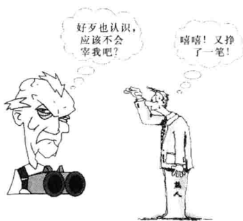
图 1-1 装修“宰熟”要防范

家装行业一直流传着“装修不能找熟人”的说法，“宰熟”的现象更是屡见不鲜（见图 1-1）。因此，业主在选择装修公司的时候一定要谨慎，不管是熟人介绍，还是自己物色，都应该对其以往的工程进行考察。其中，工人的素质和办事效率要重点考察，因为它们在很大程度上决定着工程的质量和进度。此外，不论找什么人装修，都是在进行一种经济行为，一定要与对方签订施工协议和相关合同，严格按照合同办事，争取把可能出现的损失降到最低。