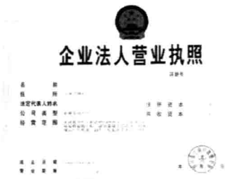
图 1-2 营业执照

(1) 看装修公司是否有正规的营业执照、资质证书及等级，是否具备相应的设计、施工能力。现在的装修公司主要分为直营店和加盟店两种，前者的管理和资质独立，可靠性高，但收费也较高；后者的营业执照（见图 1-2）及资质证书（见图 1-3）都是用总店的，为获取业务，收费相对较低，业主在调查时应认真比较。