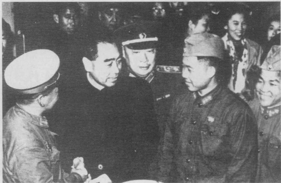
周恩来、陈毅接见志愿军代表团