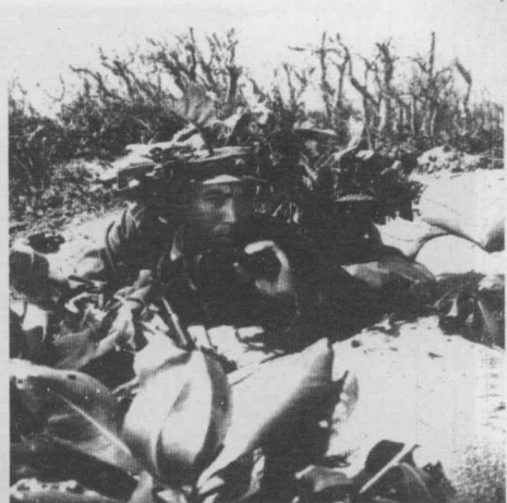
战斗在西沙群岛上