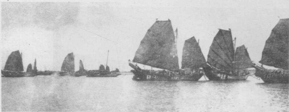
参加海南岛战役的船队启航