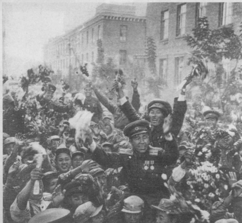
三年的抗美援朝战争，迫使美国在战争协定上签了字，赢得了伟大的胜利。