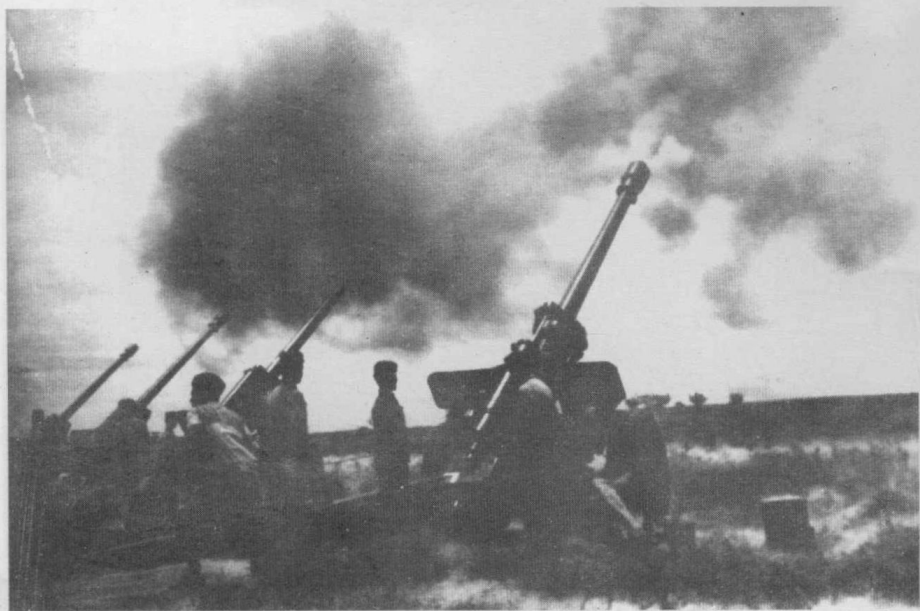
福建前线部队炮击金门