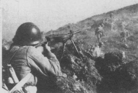
解放一江山岛的部队发起攻击