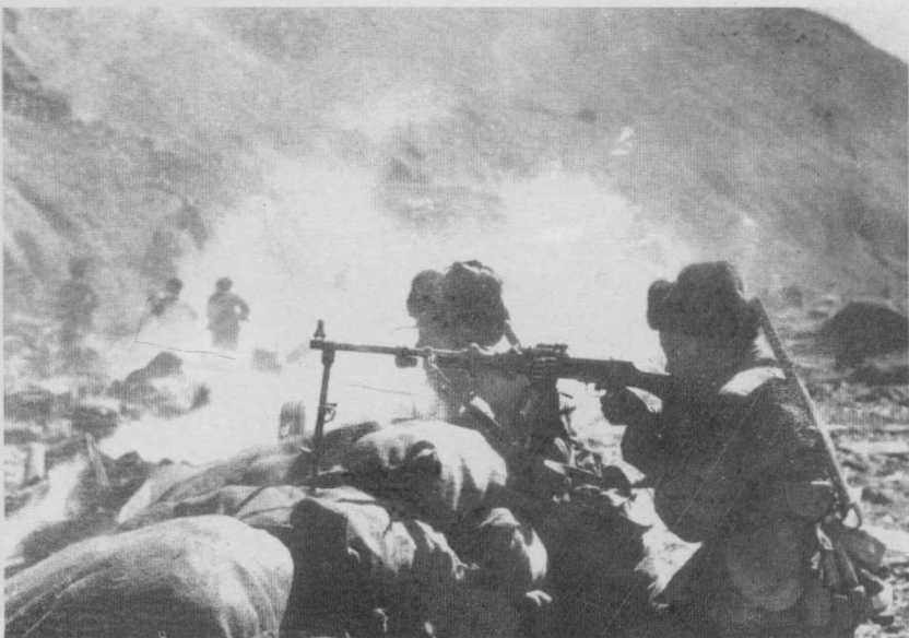
边防部队在中印边境进行自卫反击