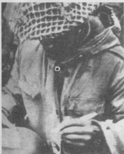
印军少校在移交清单上签字