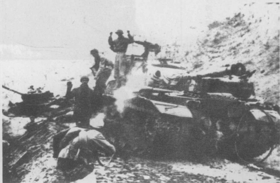
志愿军缴获美军坦克