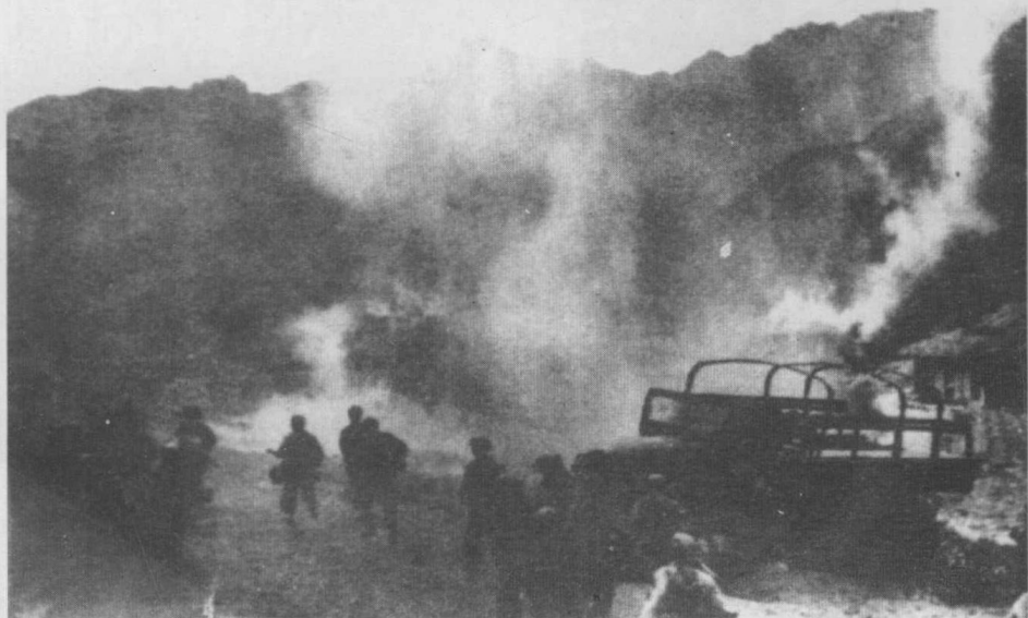
志愿军在朝鲜加平地区向美军第二十四师进攻