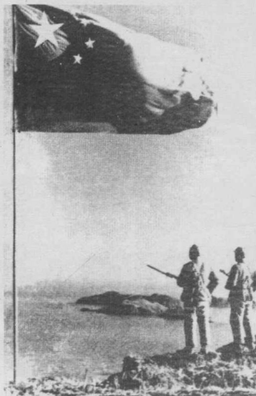
五星红旗插上大陈岛