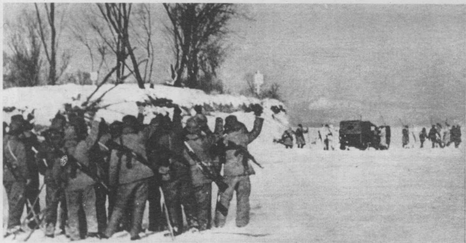
战斗在前沿的边防部队指战员，同入侵的苏联军队进行针锋相对的斗争。