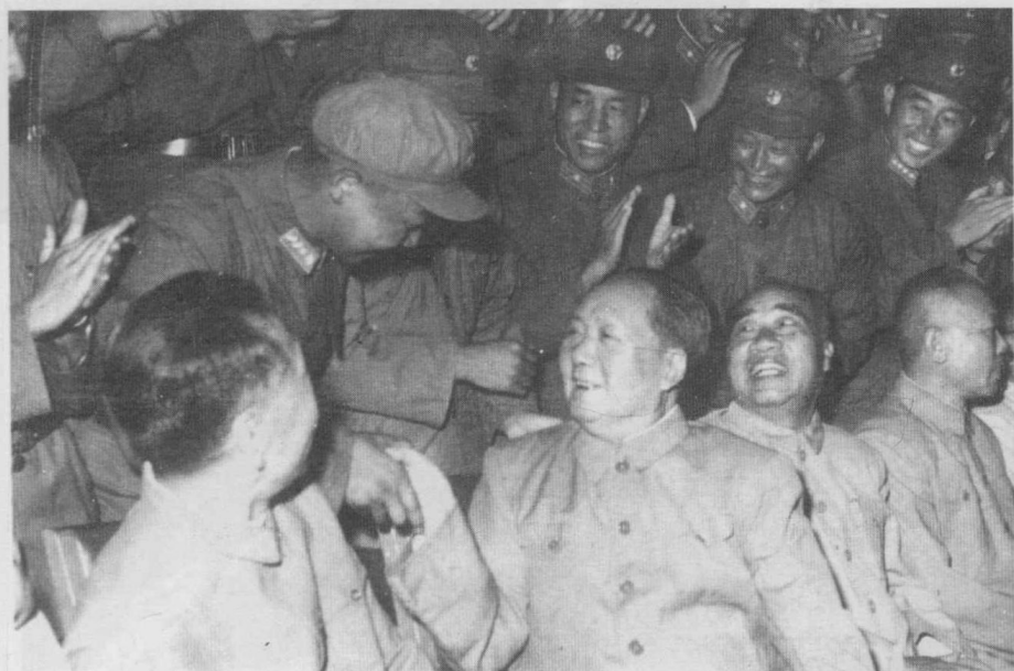
毛泽东、朱德、周恩来等接见击落U-2型飞机的有功人员