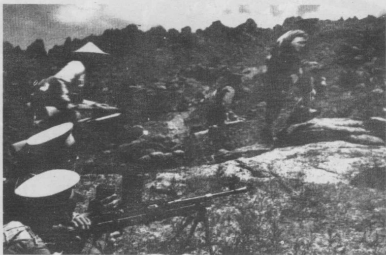
剿匪部队围歼股匪