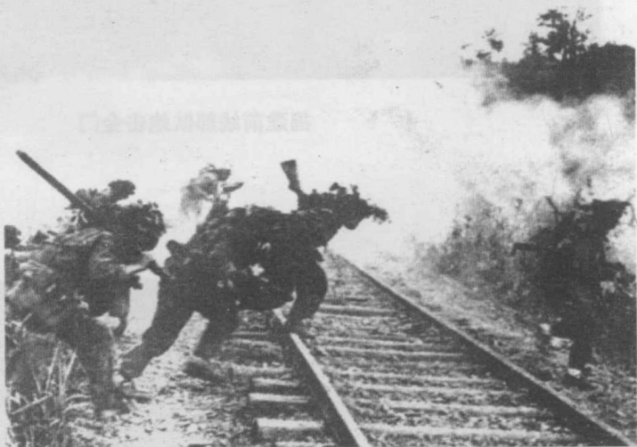
志愿军炮兵部队开赴前线