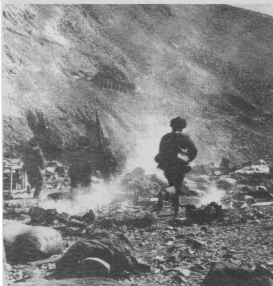
边防部队追歼入侵的印军