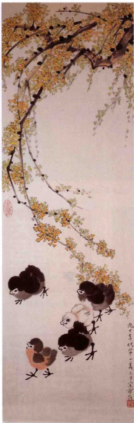
平反后的第一张作 品《迎春花和小鸡》