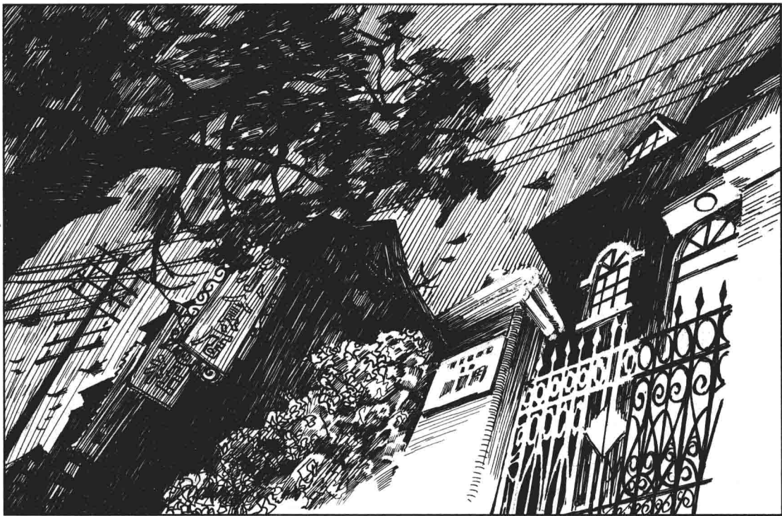
(1) 1946年秋夜，上海马斯南路106号对面的周恩来公馆伫立在瑟瑟秋风中，四周一片漆黑。