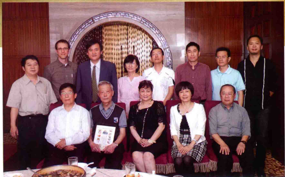
图4 授课专家合影之一