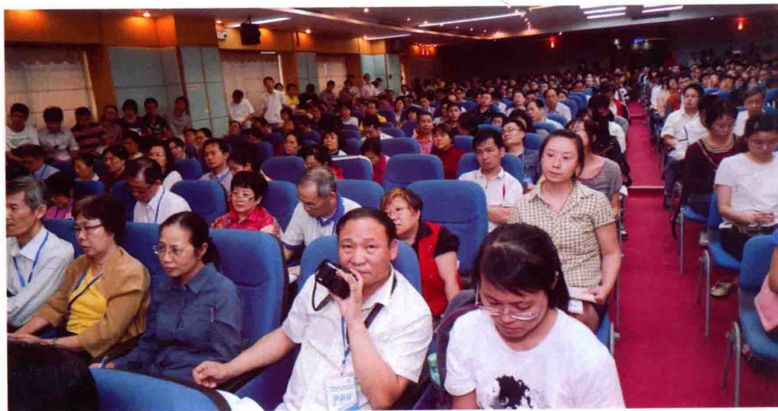
图7 首届国际经方班现场一隅