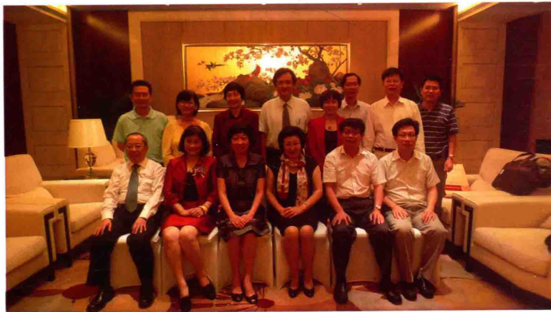
图3 广东省中医药局、广东省中医药大学与附属医院领导看望部分专家