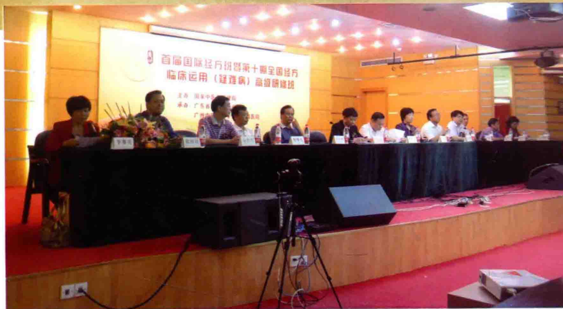
图2 首届国际经方班开班仪式主席台