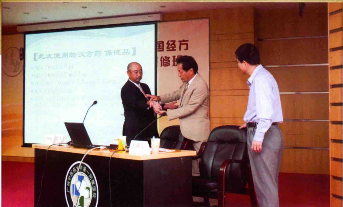
图10 日本授课专家现场做演示