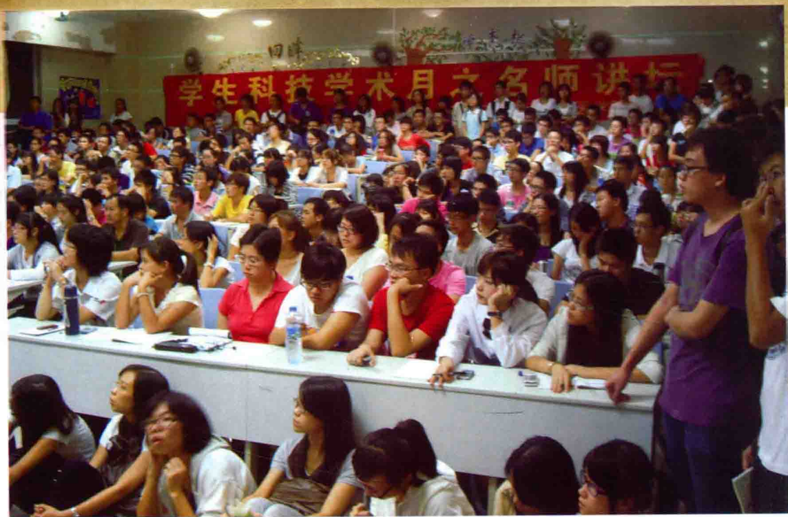
图6 首届国际经方班会场座无虚席