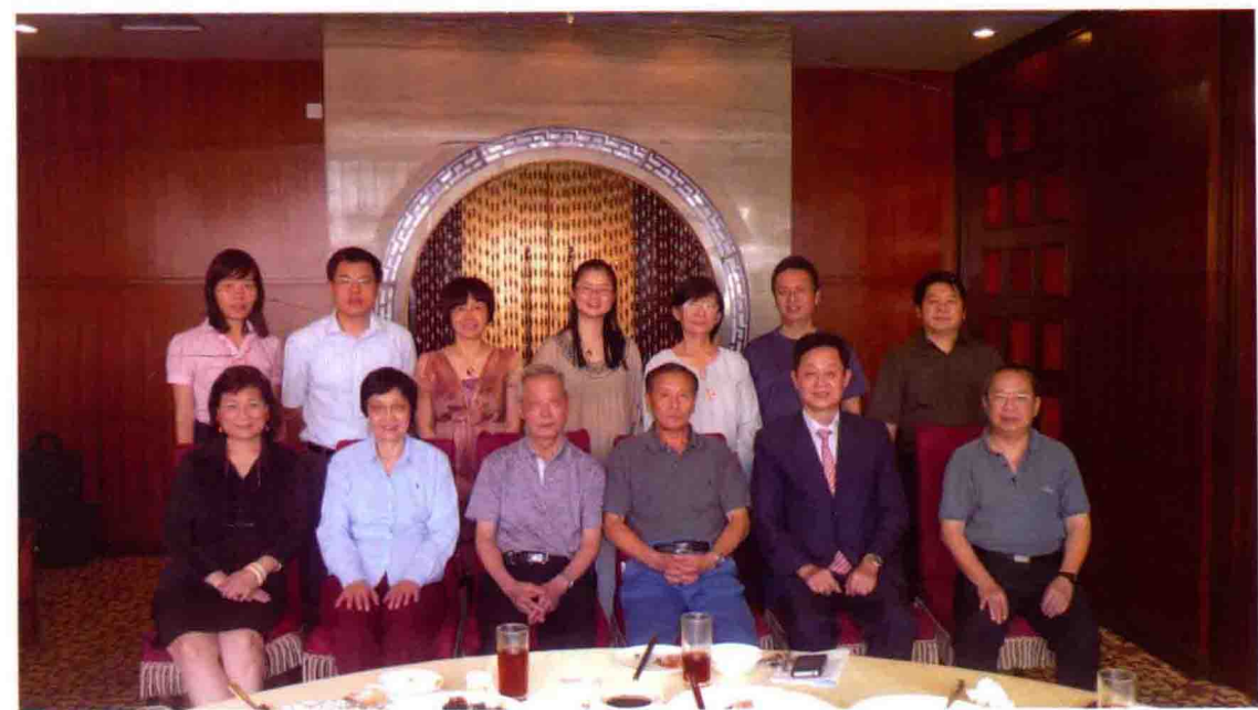
图5 授课专家合影之二