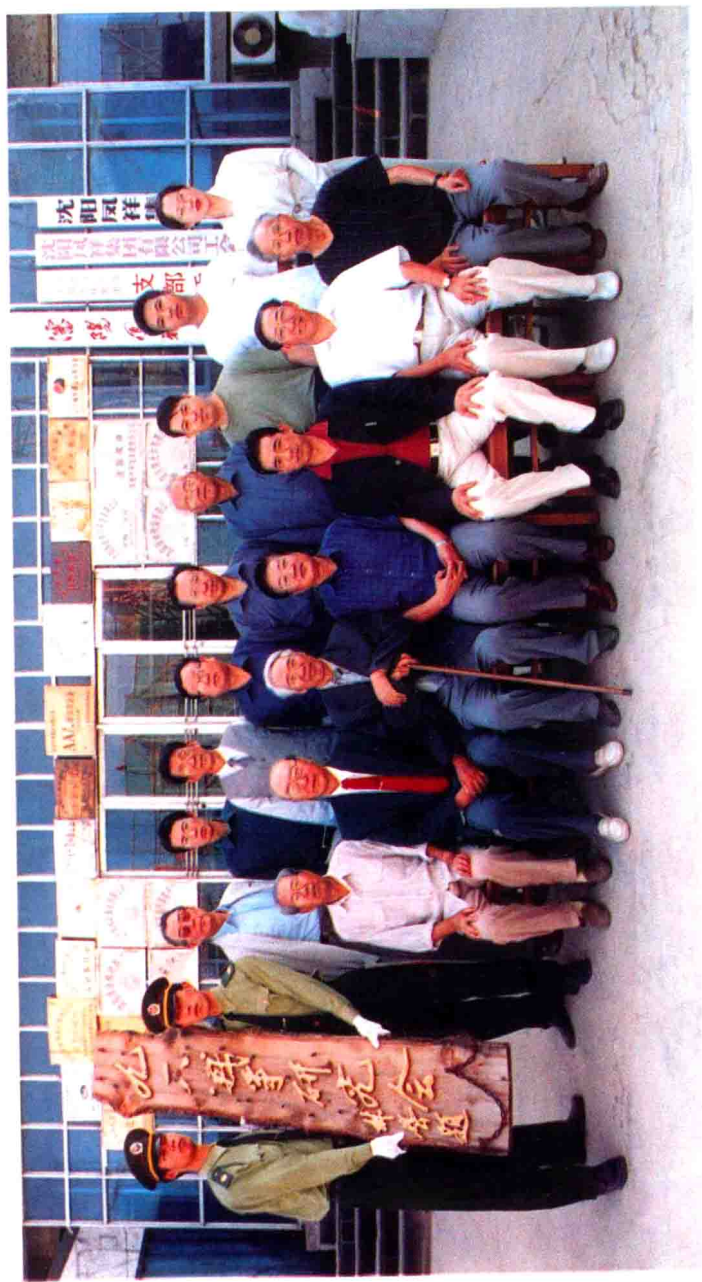
辽宁省原副省长林声(前排右四)与《九一八战争》编委会部分成员合影