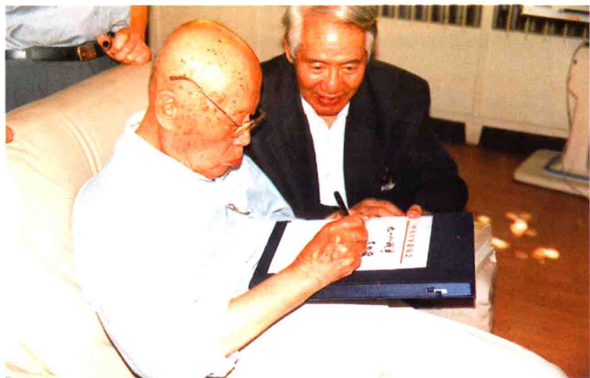
全国政协原副主席吕正操上将将为《九一八战争》题写书名，旁为辽宁省九一八战争研究会会长张一波教授。