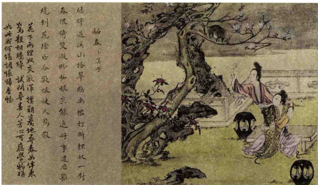
清 佚名 姝春