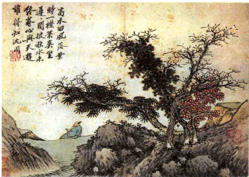
明 沈周 高木西风落叶时