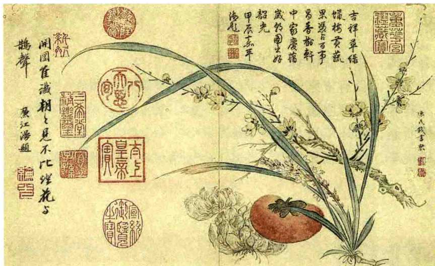
清 陈氏钱书 吉祥瓜草

兰叶春葳蕤，桂华秋皎洁。 欣欣此生意，自尔为佳节。 谁知林栖者，闻风坐相悦。 草木有本心，何求美人折？