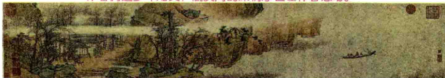
明 仇英 赤壁怀古