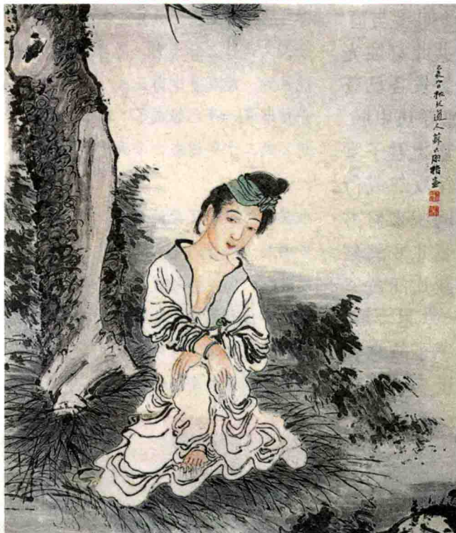
清 苏六朋 松下仕女