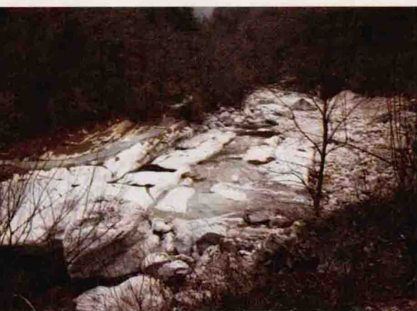
◎ 今人翻修的祁山道