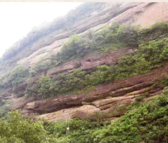
◎ 剑门蜀道是金牛道的一部分