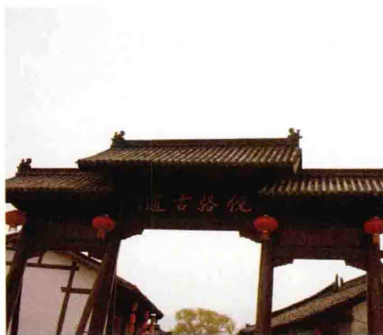
◎ 华阳古镇是褒斜古道上最大的驿站