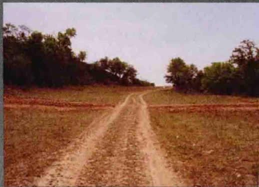
◎ 富县境内秦直道遗址