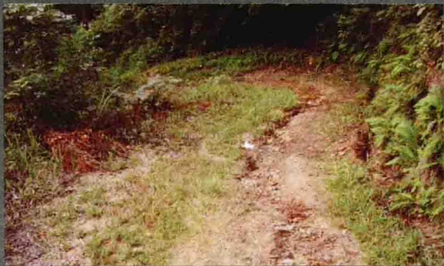
◎ 韩城境内一段驰道遗址

古往今来，这条古道上时而上演腥风血雨的战争、纷乱，时而上演和风细雨的交流、沟通。如今，古道西风依旧，昔日辉煌不再。我们小心翼翼地探寻于群山之巅，感悟于古堡残阳，与千年古道对话，期望穿越漫漫时空，揭开古道所蕴含的人类文明，聆听那一个时代给我们带来的声音，铭记我们祖先走过的艰难的历程，在历史中感受曾经残酷，在现实中享受和平的愉悦。