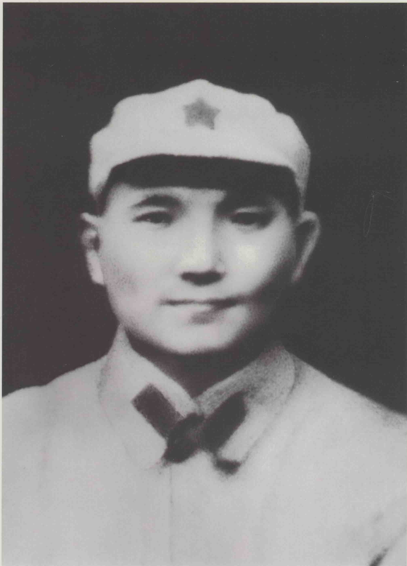
土地革命时期的邓小平。