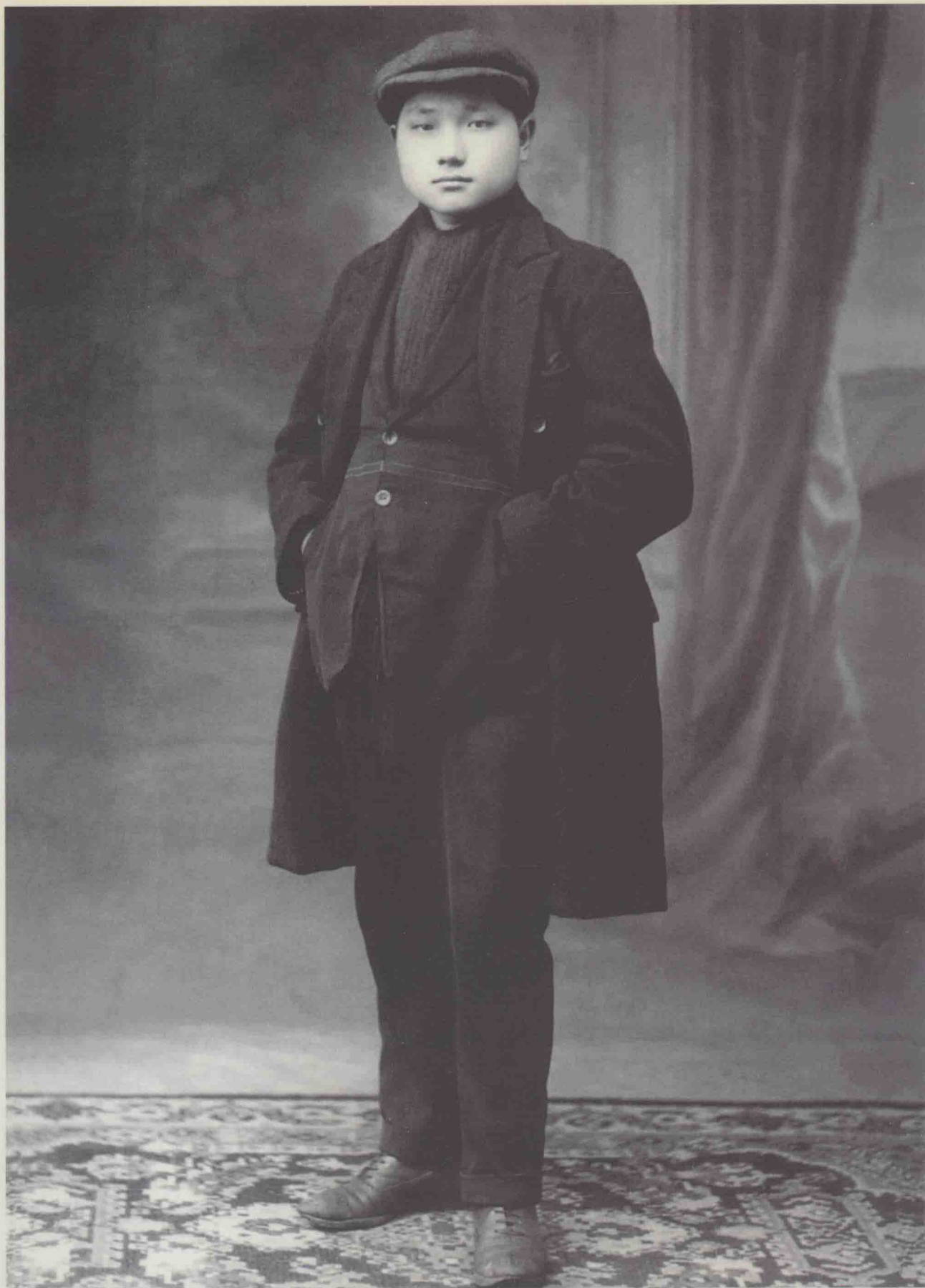
留法勤工俭学时的邓小平。