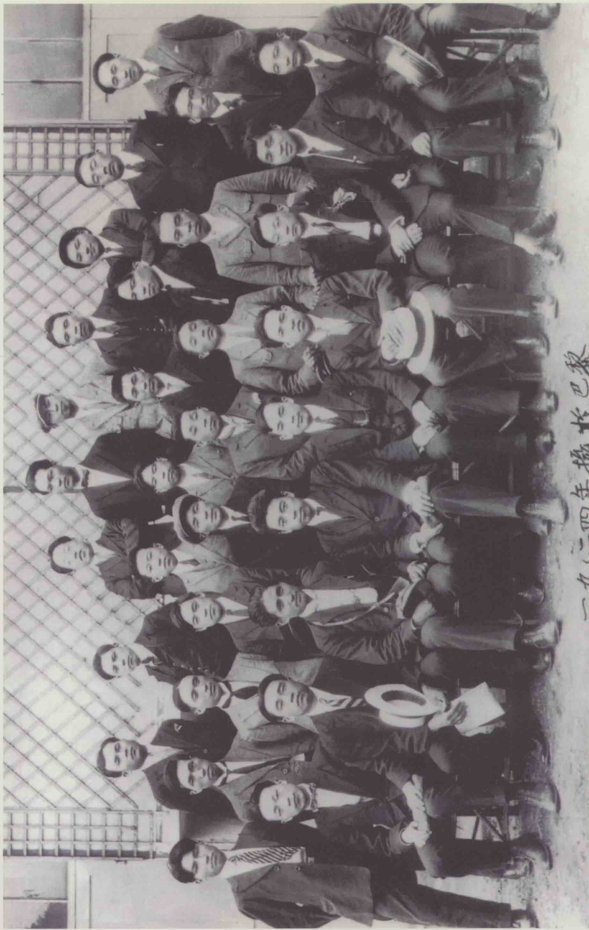
1920年夏，邓小平赴法国勤工俭学。1922年参加旅欧中国少年共产党，1924年转为中国共产党党员，从此走上无产阶级职业革命家的道路。图为中国社会主义青年团旅欧支部代表在法国巴黎合影。（后排右三为邓小平）