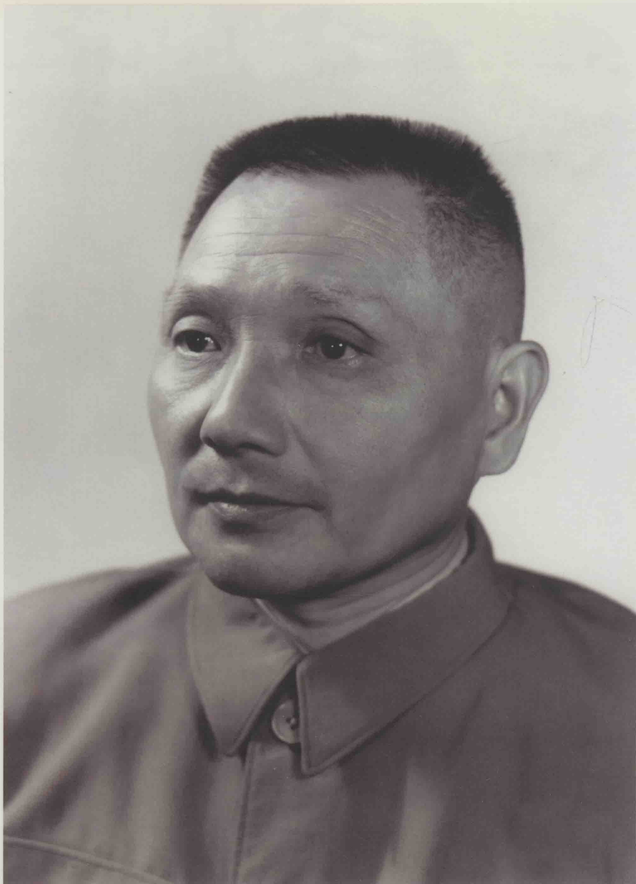
1956年9月，邓小平当选为中共中央总书记。