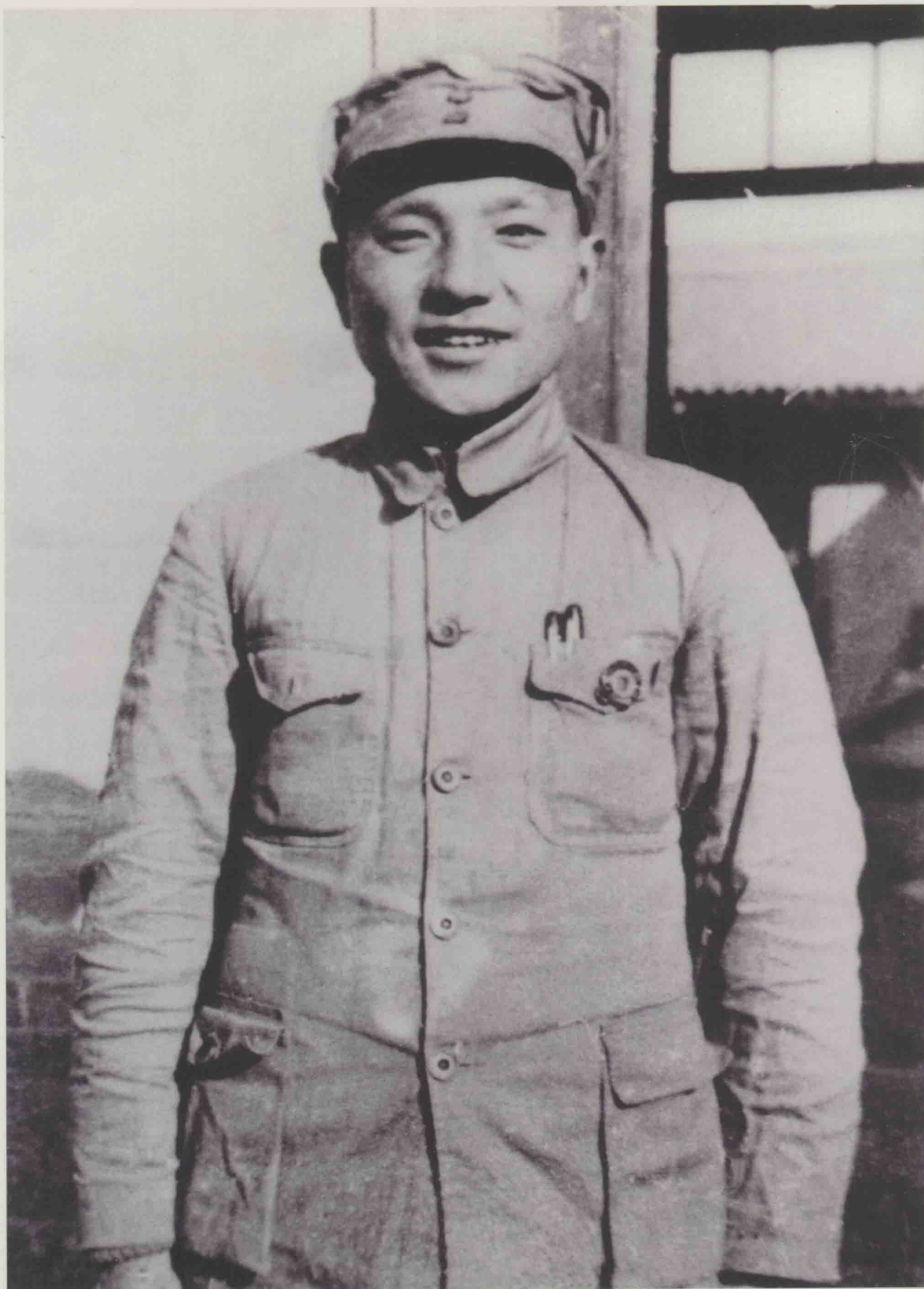
抗日战争的邓小平。