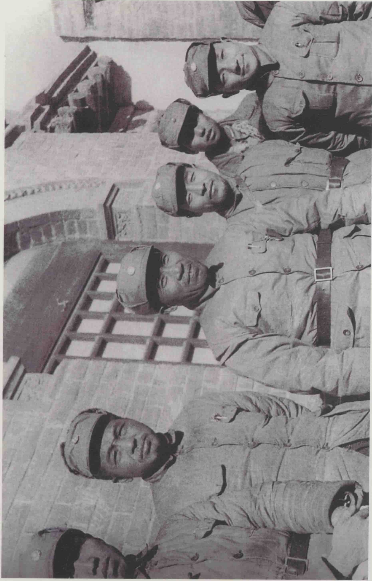
抗日战争中，邓小平任八路军129师政治委员，1942年后任中共中央北方局太行分局书记，代理北方局书记，主持八路军总部的工 作，开辟和领导华北敌后抗日根据地。在党的七大上当选为中央委员。图为抗战时期邓小平和朱德、彭德怀等合影。