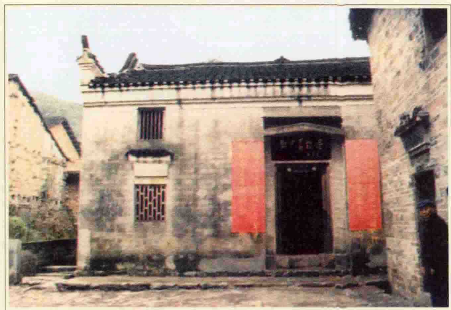
邓中夏故居。1994年，由政府重修，江泽民题字。