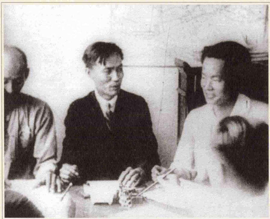
1926年，苏兆征和邓中夏在省港罢工委员会会议上。