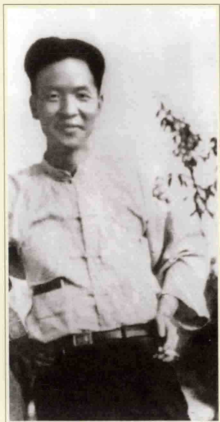
省港大罢工中的邓中夏。

1924年，邓中夏曾在中国国民党上海执行部工作。一起工作的还有毛泽东、恽代英和向警予。