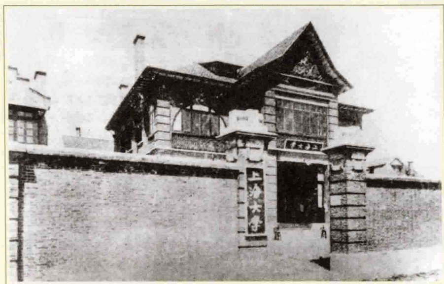
上海大学旧址。1923年初，党中央派邓中夏和国民党合办上海大学，任校长。