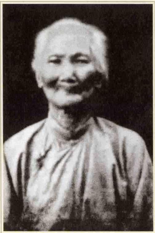
邓中夏的祖母：邝太夫人。