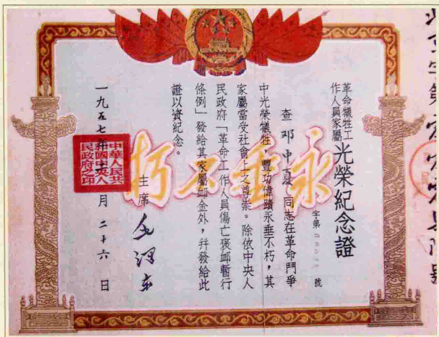
1957年，毛澤東簽發的給鄧中夏家屬的《光榮紀念證》。