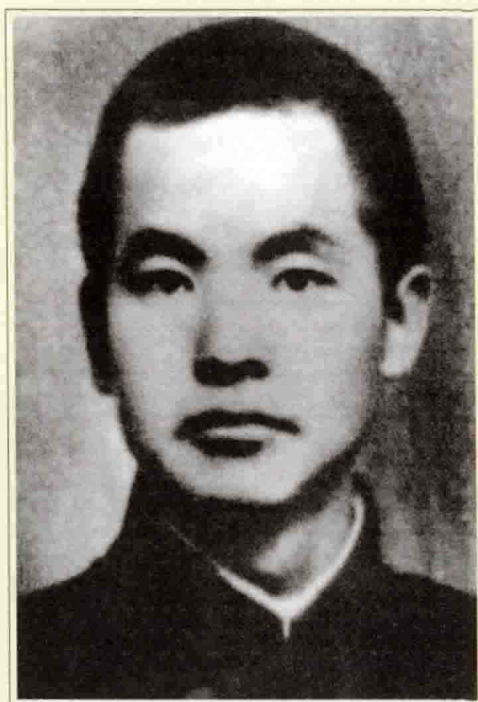
1913年邓中夏在郴州中学时的照片。