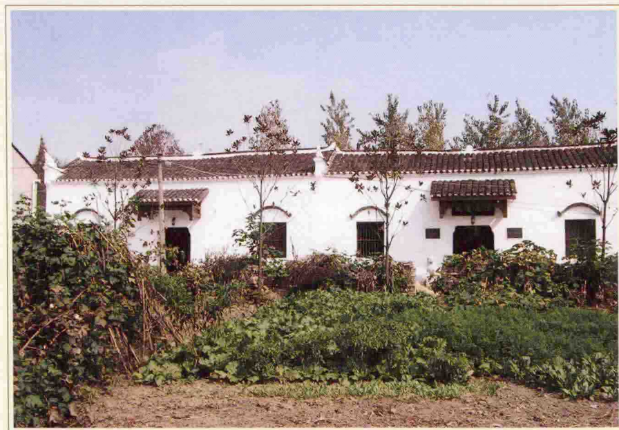
邓中夏1930年在洪湖周老咀的旧居，即红二军团指挥部旧址。