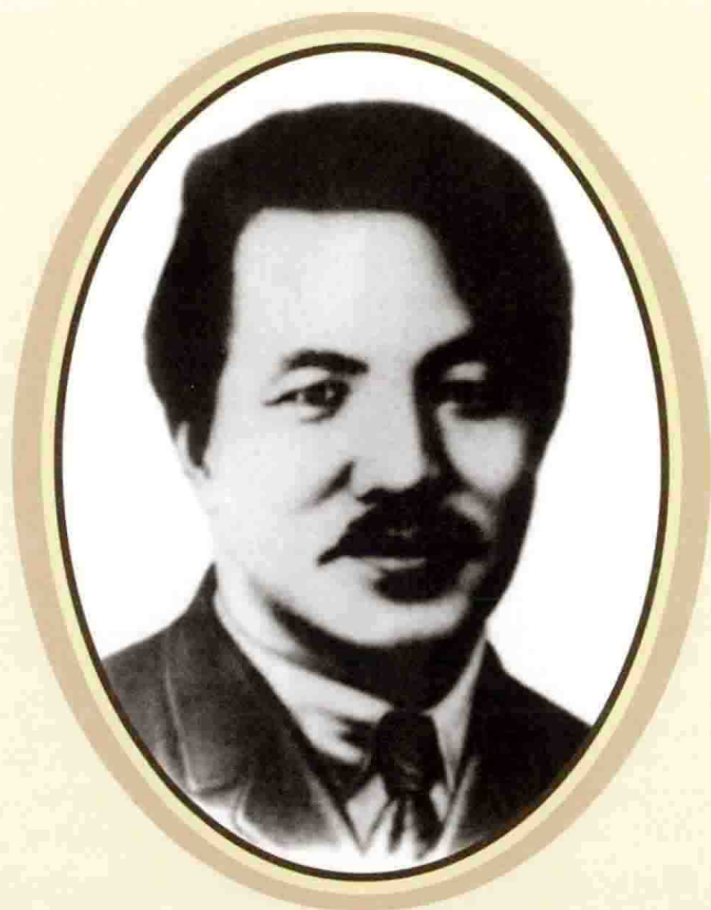
邓 中 夏 ( 1894—1933 )