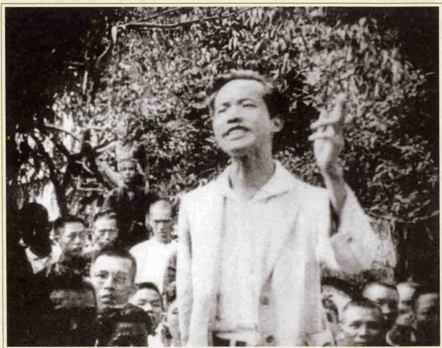
邓中夏在省港罢工工人代表大会上作报告。