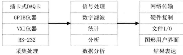
图 1-1 虚拟仪器构成方式

图 1-1 中采集处理模块主要完成数据的调理采集；数据分析模块对数据进行各种分析处理；结果表达模块则将采集到的数据和分析后的结果表达出来。