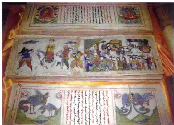
托忒蒙古文手写经文