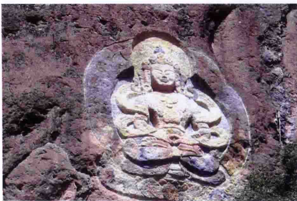
内蒙古阿拉善南寺附近山上的石刻佛像