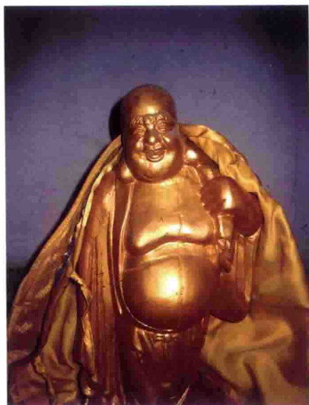
内蒙古哲里木库伦旗老爷庙木雕(十八罗汉之一)