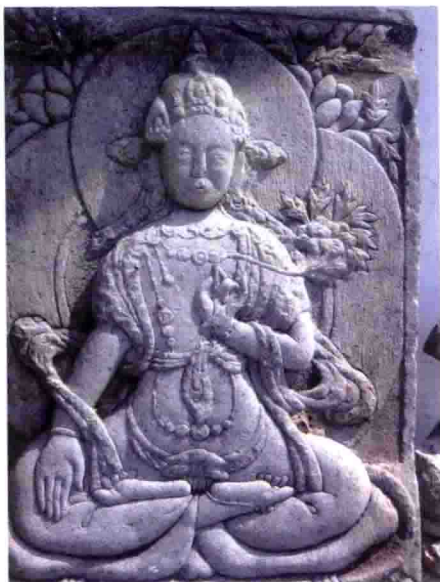
内蒙古兴安盟科右前旗葛根庙石刻佛像