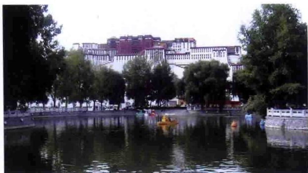
西藏拉萨布达拉宫