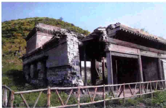
内蒙古哲里木科左后旗双合尔庙遗址