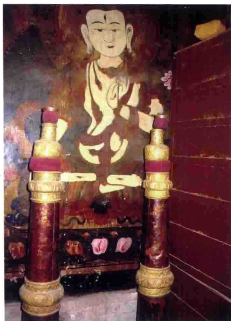
内蒙古伊克昭乌审召一属寺壁画