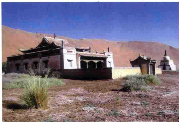
内蒙古阿拉善沙漠深处的巴丹吉林寺