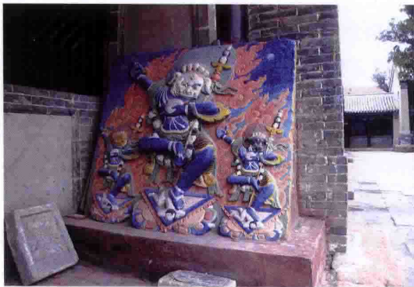
内蒙古哲里木库伦旗兴源寺石刻佛像