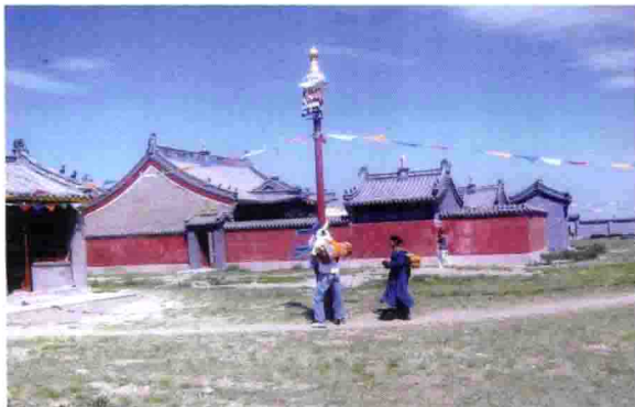
内蒙古呼伦贝尔盟新巴尔虎右旗西庙的朝拜者