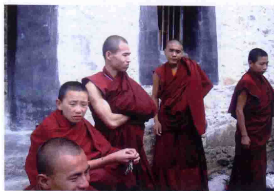
拉萨哲蚌寺珠尔沁米仓的蒙古族喇嘛