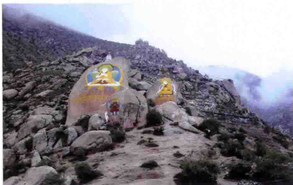
西藏拉萨哲蚌寺附近山上的石刻佛像