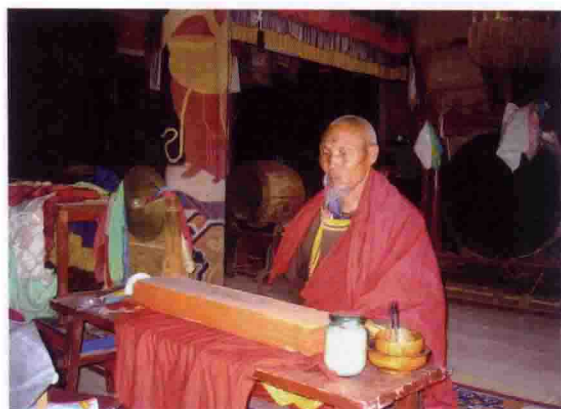
内蒙古乌审召蒙古老喇嘛在念经