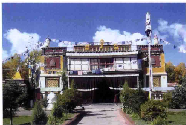
青海海西蒙古族自治州都兰县的潘德群科尔林