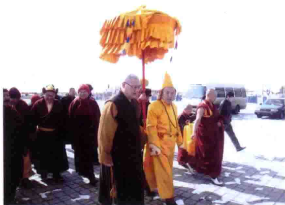
内蒙古美岱召迎接丹迺·冉纳班杂活佛