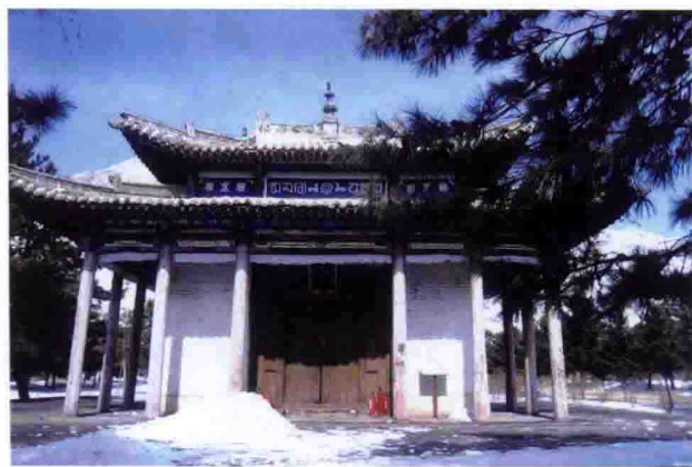
内蒙古美岱召太后殿