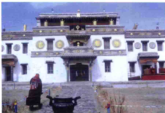
蒙古国额尔德尼昭的一位管理喇嘛