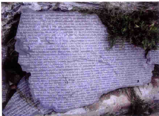
西藏拉萨布达拉宫附近的石刻佛经