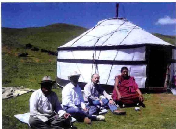
青海省河南蒙古族自治县一蒙古僧人家（右二为作者）