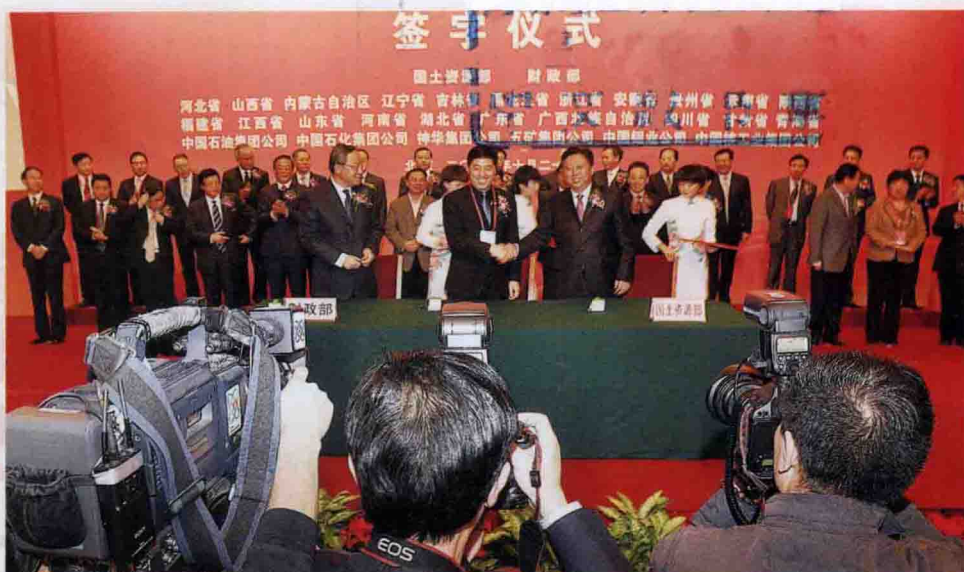
2011年10月27日，国土资源部、财政部在北京钓鱼台国宾馆与21个省级人民政府及6个中央矿业企业签署矿产资源综合利用示范基地建设合作协议。国土资源部部长、党组书记、国家土地总督察徐绍史，国土资源部党组成员、副部长贡小苏出席仪式并向建设单位授牌。河北省副省长张杰辉代表省政府与财政部副部长张少春、国土资源部副部长汪民签署河北冀东地区矿产资源综合利用示范基地建设合作协议