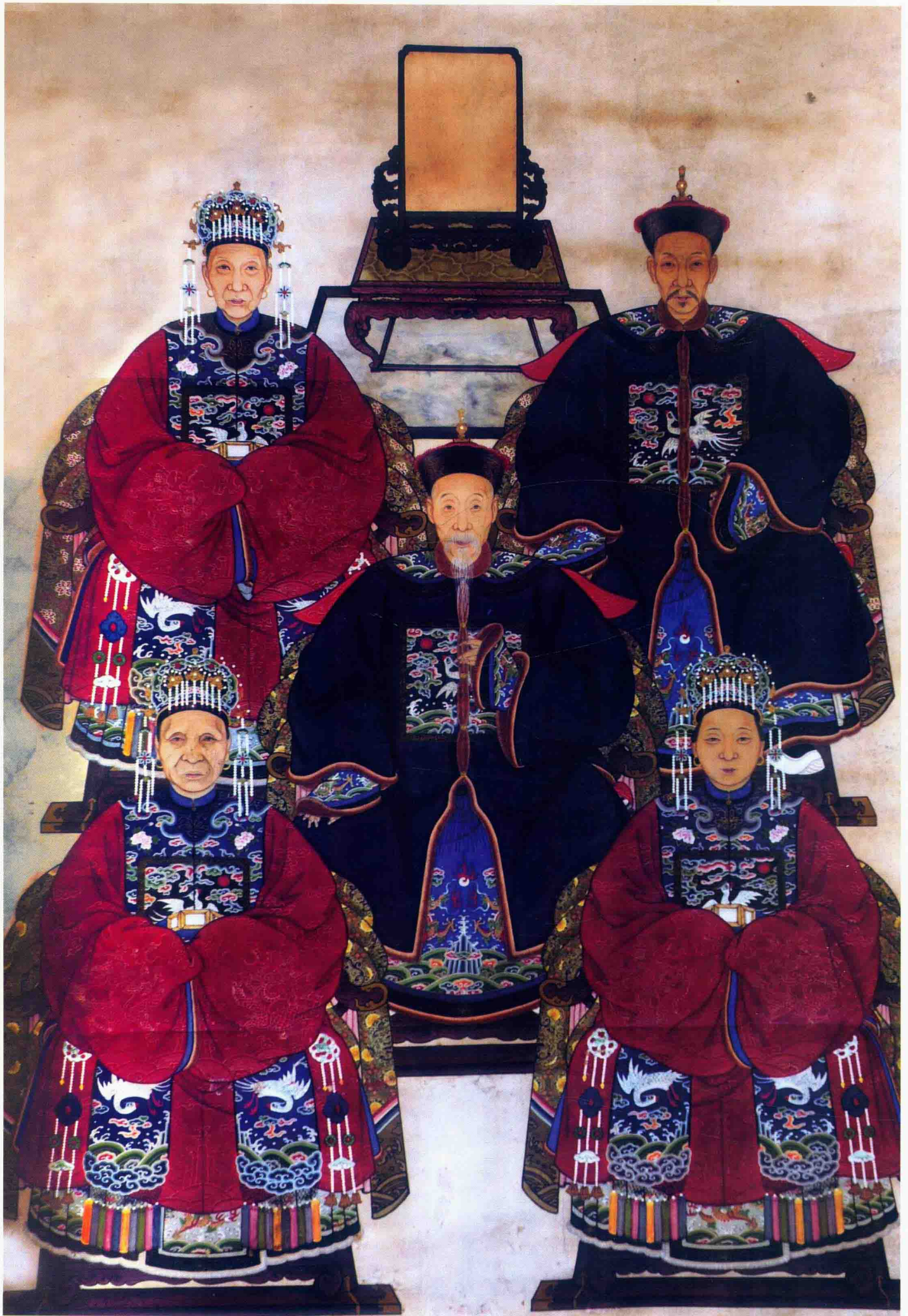
清代官宦家族肖像，女眷们头戴凤冠、步摇和簪钗