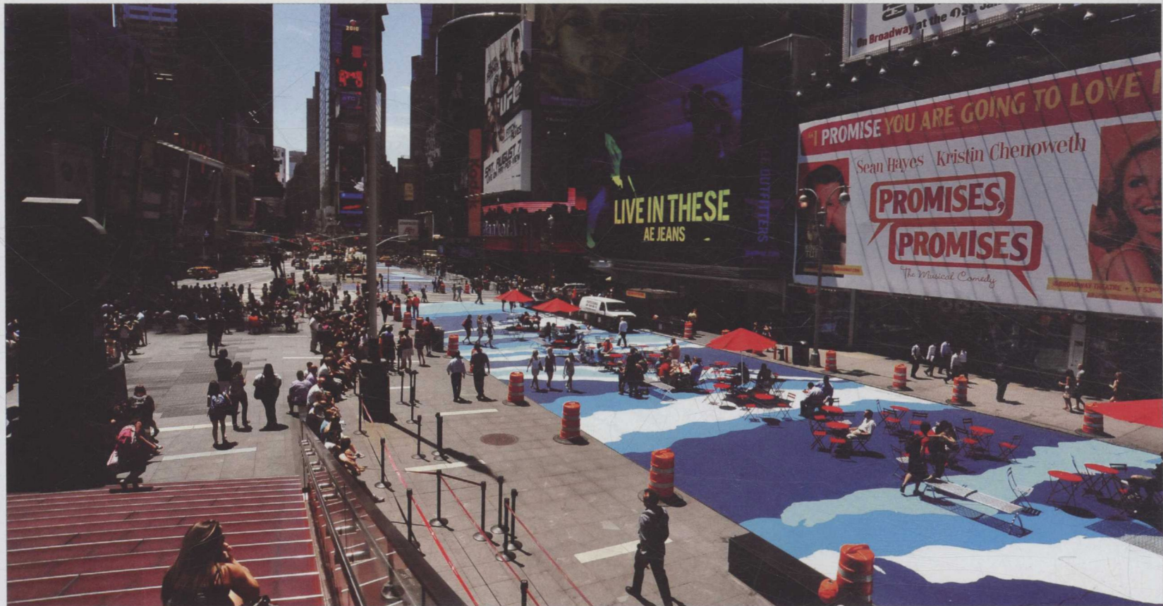
图1/1 现代公共艺术环境

主要表现手段。现代壁画设计由传统表现方式发展为多种形式, 强调与环境的紧密结合性, 甚至壁画的设计就是在建筑功能或空间环境意义上进行延伸, 材料与手法上的多样性产生了丰富的变化, 当然这些多元化是随着现代科学技术发展、现代建筑功能丰富与空间环境变化而逐渐繁荣的。因此, 当代壁画设计的概念应该为: 它是针对特定空间中的建筑实体的某部位, 根据一定的目的与要求而进行的关于造型艺术主题、内容、色彩、材料及表现形式等方面的创造性设想与计划。利用建筑空间及其内外环境为载体, 在室内外墙壁、承重柱、天花