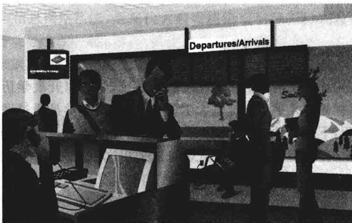
图 1-1 网络使用示意图

网络是指“三网”,即电话网络、电视网络和计算机网络。发展最快的并起到核心作用的是计算机网络。在图 1-1 中,人们正在使用不同类型的网络,有计算机网络、电视网络、有线电话网络、移动电话网络。